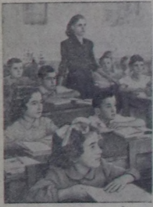
АЛБАНИЯ. Хосталган албани улус билдирери чыгууду биле шигеңди ап турар. Школарын, культура ордуларын, театрларын, библиотекаларын, музейлерин саны үзүктөл чокка өзү турар. Шаңда чыдаң-на ажалымдарың болгаш тараачыларың 140.000 уругулар школага өрөмбөй турганар. Ам школада өрөмбөй турар чагыс-даа школа назымг уругулар чок.