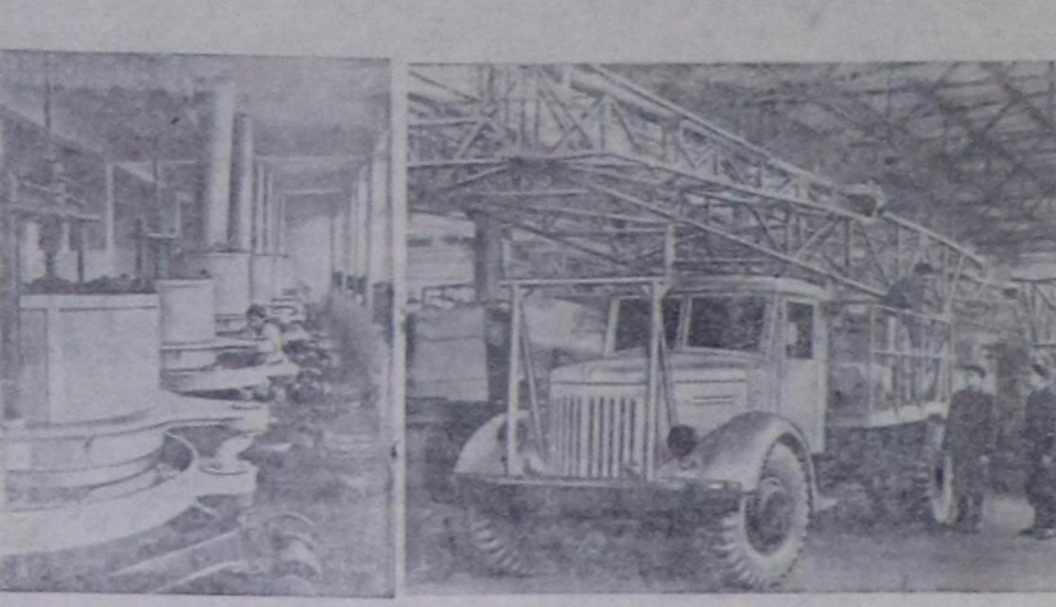
Чурунта: 1. Азербайжан ССР-ниң Ленкоранда шай фабриказынын ролер цехи. Ол фабриканы чазартып кылганы болгаш чаа техник-биле ону чепселзөөн болза, бөдүрүлгениң күчүзүн дөт катар улагытарын органы берген. Фабриканын коллектив чыл планын хуусаа бетинде күөсеткен. 2. Молотов областың Кунгирскке машина тудуушкуну заводу көлө ажыл-агыйга чер өрүңкөн үтөөр херекселдерин мөөңү-биле кылмы үндөдөрүн шингээдип алган. Артезиан кудуктар кастырыны-биле индиг механизмерин күр черлер шингээдип амыр районнарже хойну чоруткан. Кур черлер шингээдип амыр черлерже ам чорудары-биле белеткэн чер өрүңкөн үтөөр херекселдер. 3. Ростов областың Новочеркасскке чаа кондитор фабрикасы ажылдады кирген. Оон күчүзү—чылда 1.000 тонна кондитор кылдыларын үндүрери болуп. Фабрикада бөдүрүлгө ажылдарын калбаа-биле механизастаан. Алды сөрт конфеттерин кылмы турар механизастагырган агрегат.