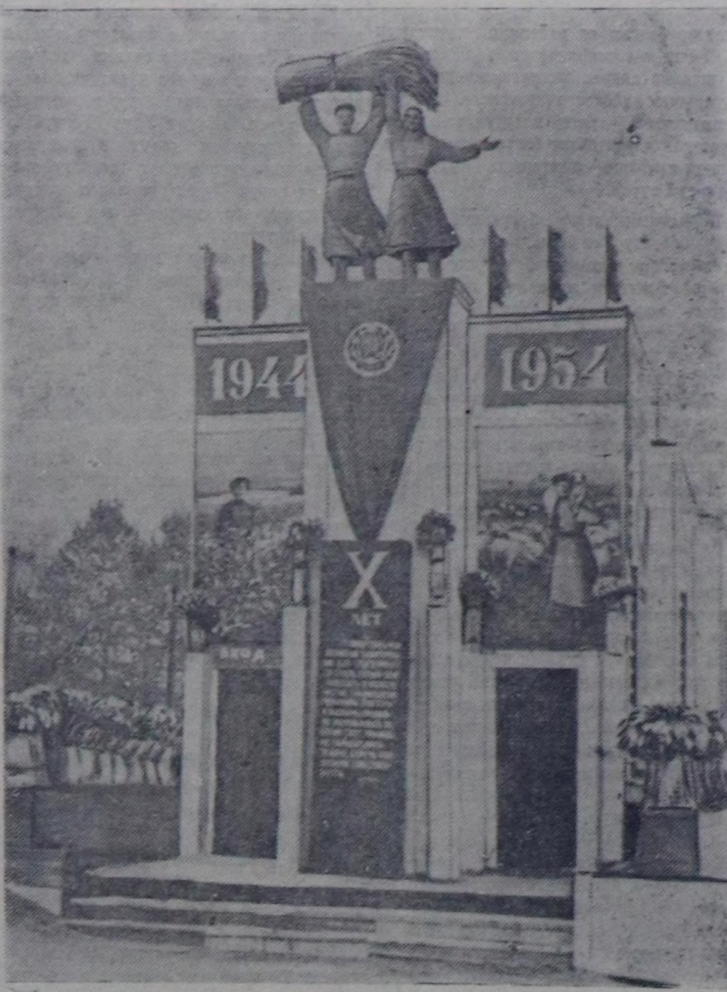
Областың көдээ ажил-агый делгелгезинин павильону.

Областың көдээ ажил-агый делгелгезинде Би-Хем, Сарыг-Сеп, Шаган-Арыг МТС-терин чедишкенини болгаш механизастаашкының түндөдөрүн көргүскөн. Ол МТС-терин ажилыңа чедиң алдылган дуржулгаларың областың бүү МТС-теринге болгаш колхозтарыңа негептери чугула соруга болур.