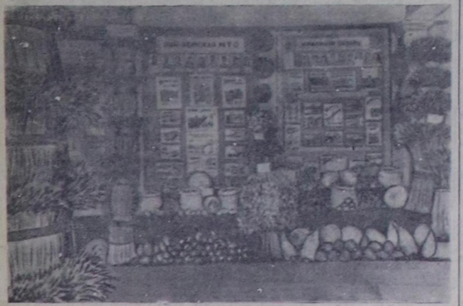
Би-Хем районда миллионер «Бызыл тараачын» колхоз. Чурукта: Ол колхозтуң көргүзүлгөриң делгелгери.