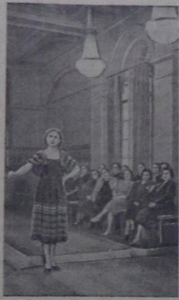
Ленинградтың модельдер бажыны Ленинград, Псков, Вологда, Новгород, Великолук, Калинин болгаш Архангель областарына болгаш артельеларына даараар хептеринк хевирлерин кылып турар.

Чурукта: чайгы платьениң чаа моделин көрүп турары.