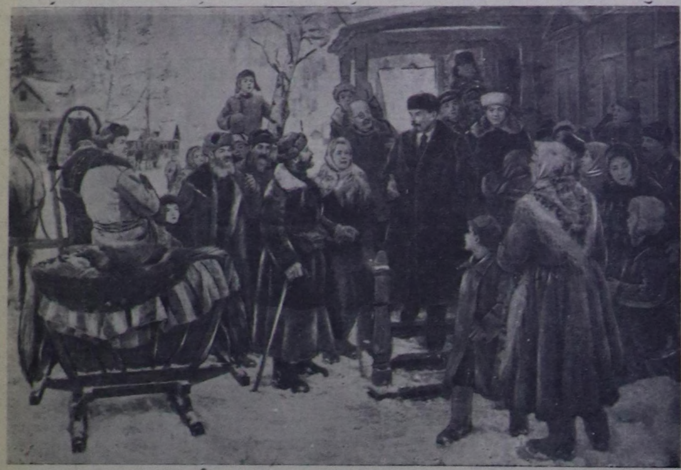
В. И. Ленин болгаш Н. К. Крупская 1921 чылда Горки көдээге тараачынар аразында. Чурукчу Н. Сысоевтин чураан чуруу. СЭТА-ның фотохрониказы.