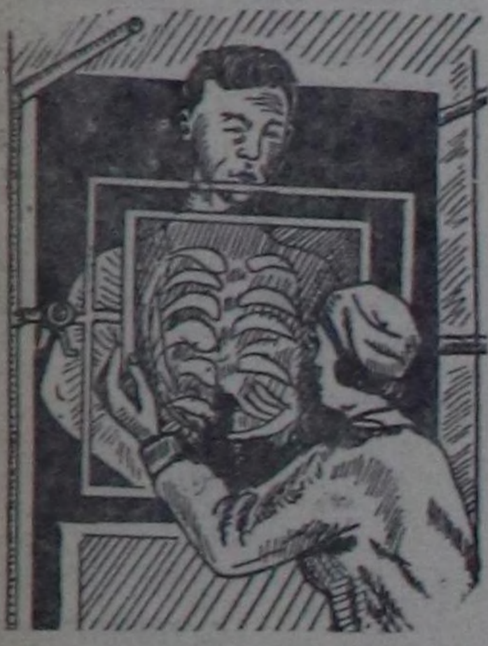
Туберкулёз мырыңай-ла чүзүм-базын оруктарны дамчытып чыпшынып халдаар. Чөдүл ийикле азы.

рышкын үезинде чарааның чаштаанын, туберкулёзтуг аарыг кижиле чугалажышкын үезинде, туберкулёз микробтарлыг тоозуну кирип тынганын, туберкулёз-биле аараан инъектиг сүдүн ишкенин, туберкулёзтуг кижиле дегжип кожаланышканын, ол ышкыш ооң эт-херекселни: иштики-даштыкы хевин, дүмчүк аржылыгын, чоңунар аржымылы, савадан—шопулаан, стаканын (аяан), таван болгаш өскөлери-даа эдилтенинден чыпшынып болур.