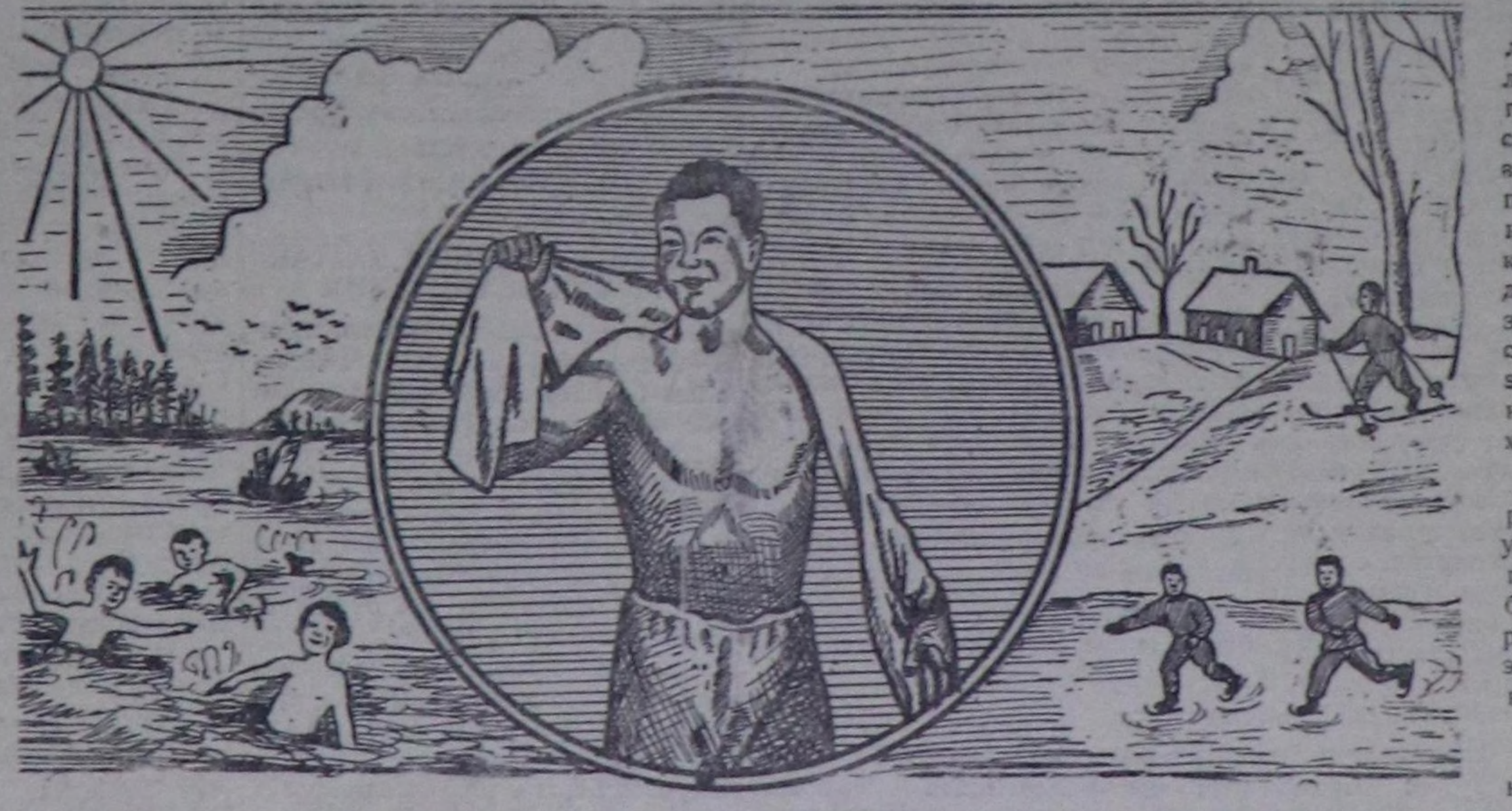
Эмчиңиң шымылганын баугаар туберкулёз диспансеринге үргүчү барып, ооң доктаамал хайпаарыңа турдуңар. Эмчи чүгле мыңчаарда ук аарыгтың кедерээшкениң баш удуру болдурбайн, ону эмнээринче чогуур өйүңде кирип болур. Хевиртен кадыкыңар баксыраза, эмчиңиң кел дээр хуусаалыңа наваыйн, доп-дораан диспансерге барыңар. Үр грипптен аарааның ийикле өкпе воспалениениң (каландаашкынының) соонда диспансерге барза чогуур.

12. Чаа төрүтүңген чаш уругларга камгалалды баш буруңгаар тарылгазын, а алээде апарганарга дагынаашкының тарылгаларны кылыңар.