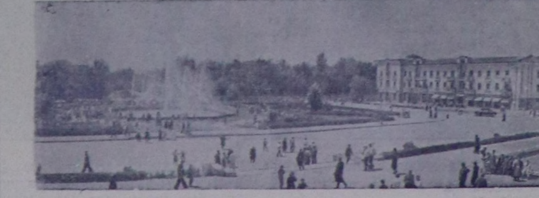
Сталинабад. Москва аттыг шөл. Чуруу Б. Зайцевтин. СЭТА-ның прессклишези.