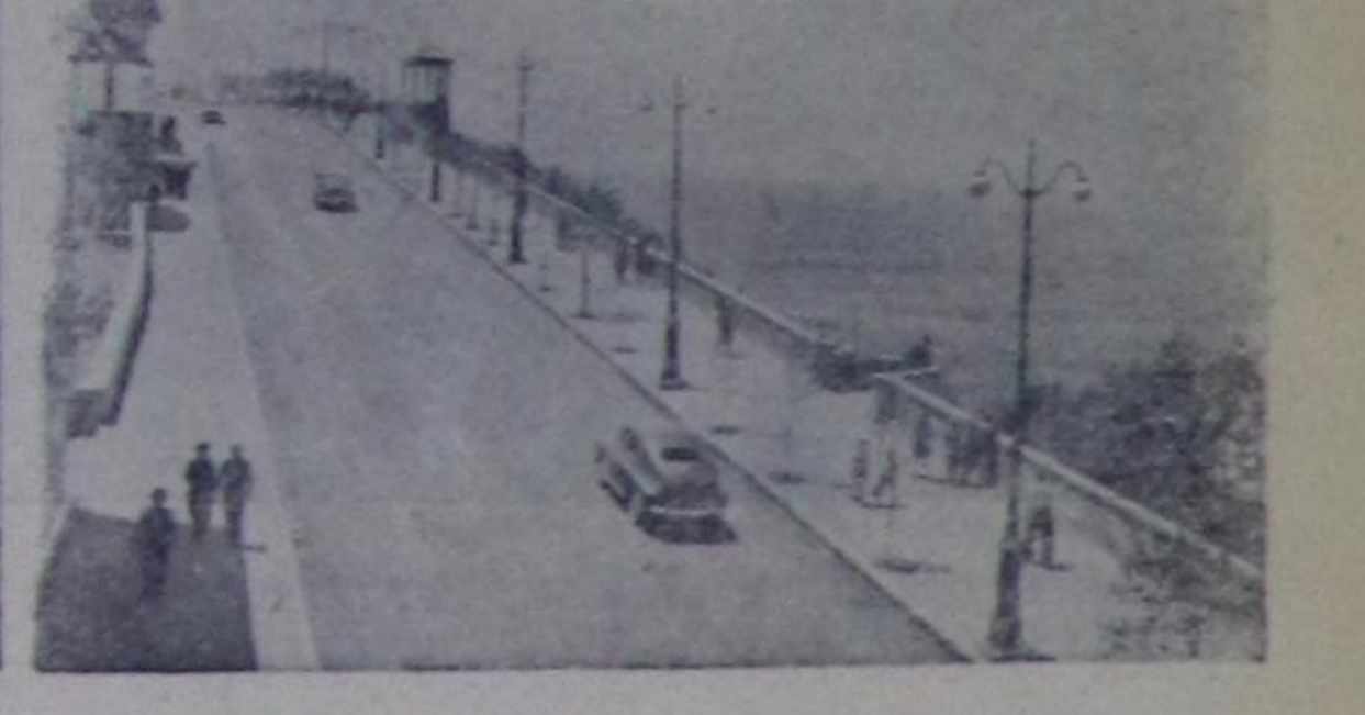
Владивосток. Набережная. Чуруу Н. Назаровтуу. СЭТА-ның прессклишези.