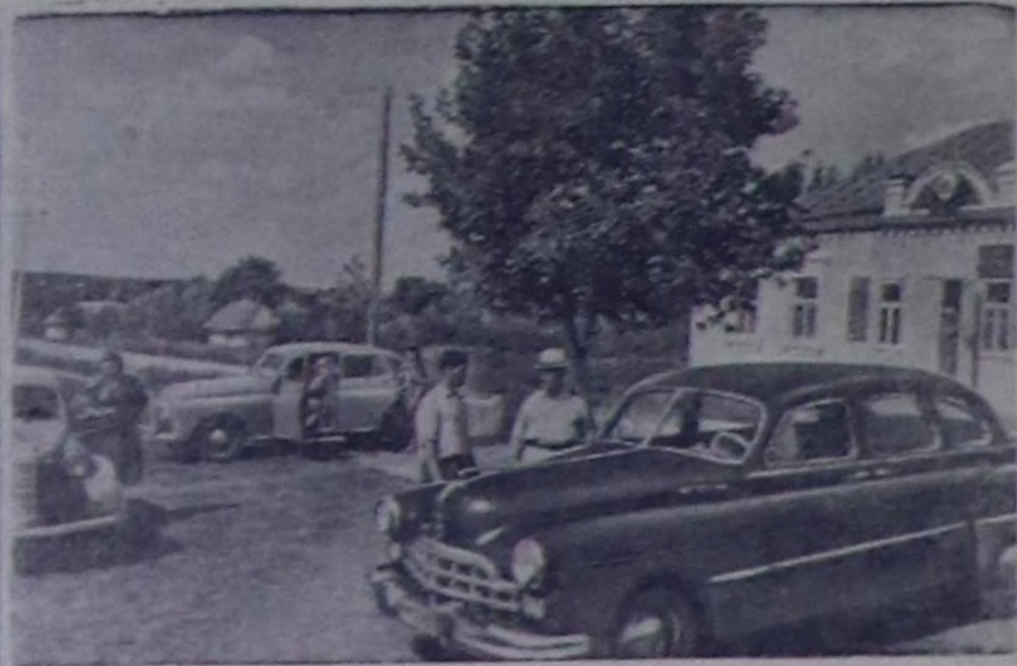
Харков область, Лозовский районнун Ордененикде аттыг колхозунун колхозчулары бай-шырак чурттап турарлар.