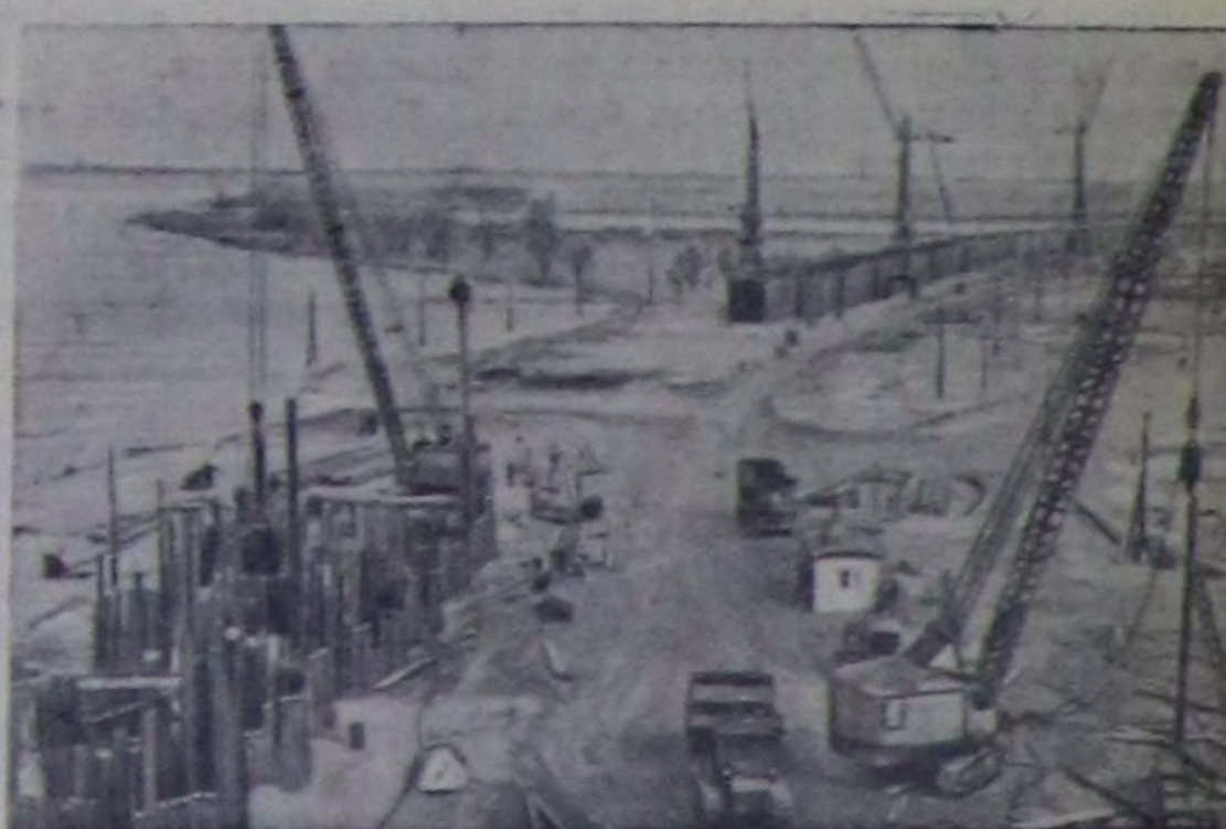
Каховканың суг белдириниң тудуушуну. Чуртута: кол ажылдары чорудуп турар улуг оттарын Днеприниң суундан камгалаар чадарын кылып турары. Чүрү Ю. Лихуванны. СЭТА-ның пресслдешез.