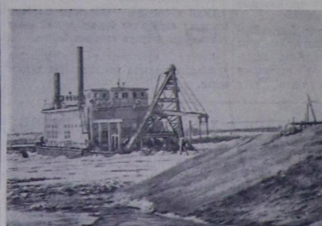
Сталинград ГЭС-тиң тудуушуну. Чуртута: № 1005 деп земснарядтын гидроэлектрик станцияныи турар чериниң алаңда улуг оттарын кылып турар. Чүрү В. Соболевтин. СЭТА-ның пресслдешез.