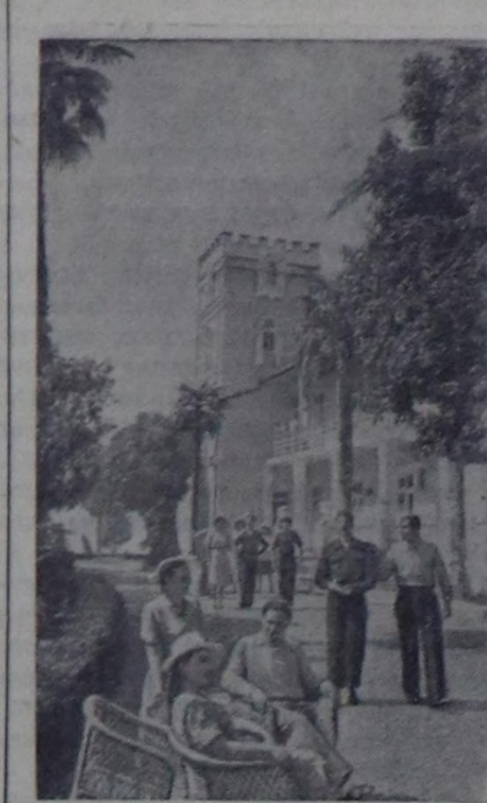
Ажар АССР. Бапитал септел- гени соода көдө ажил-агый өр- төнерин Бүгү-эвилел академия- нын дыштанылга бажыны Махи- джуринде ажилыган. Чурунга: академиянын дышта- нылга бажыны.