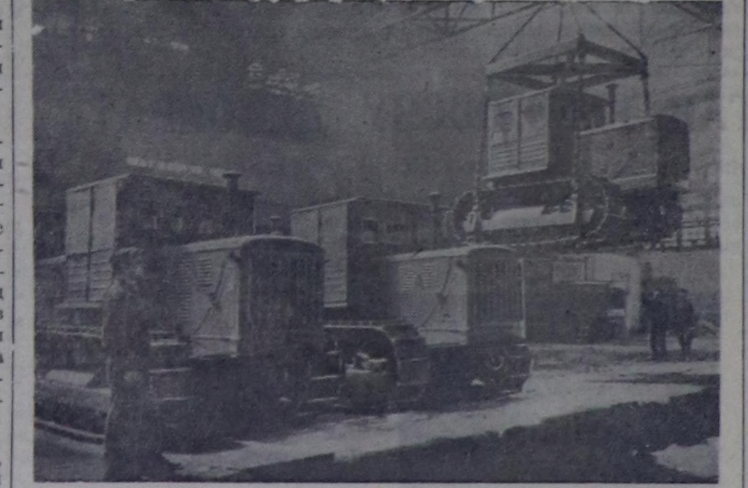
Челябинскиниң Сталин аттыг трактор заводу. Совхозтарже болгаш МТС-терже чорудар тракторларын белеткеп турары.

за күрүмнүн. Эртен чылдык бо үе- зинге дендөргө, руда кызылдан 12 хуу өскөн болгаш планга айтылганыга болдур- га бот-өрөк 2,1 хуу жуудатылган. (СЭТА).