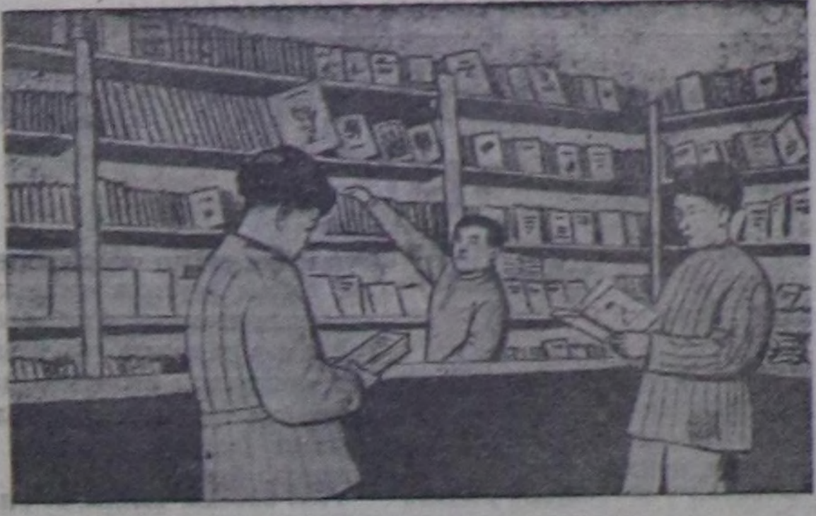
Өңү районнуң төвү Хандагайты суурда ном салың амыгыңың. Мында орус болгаш тыва кылдырты дика хей азы-бүрт номнар бар. Чуртталгың: магың эргелескиң өң Мартының салың амыччыларга номнарың шийли берип турарың.