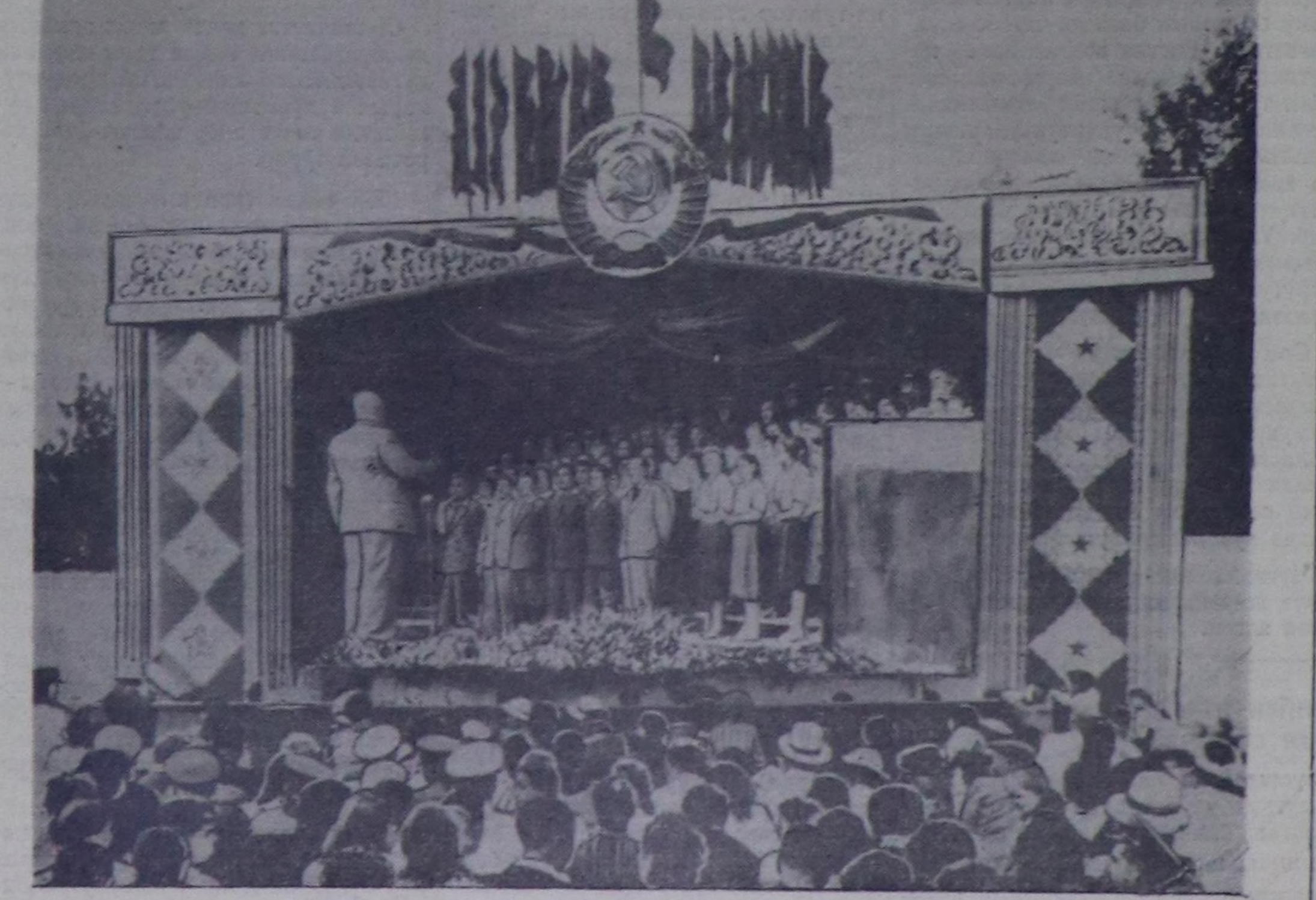
Областың бот-тывынгыр уран-чүүл көрүлдөзиниң баштайгы хүнүнде Кызыл хоорайны катышкан нийти ырының Ногаан театрга көргүзүү.

лар-дыр. Олар тыванын улустун ыры «Самагалдайны» тыва дылга кайгамчык эки күүсеткен-биле ындыг улуг сонургалды болдурганнар.