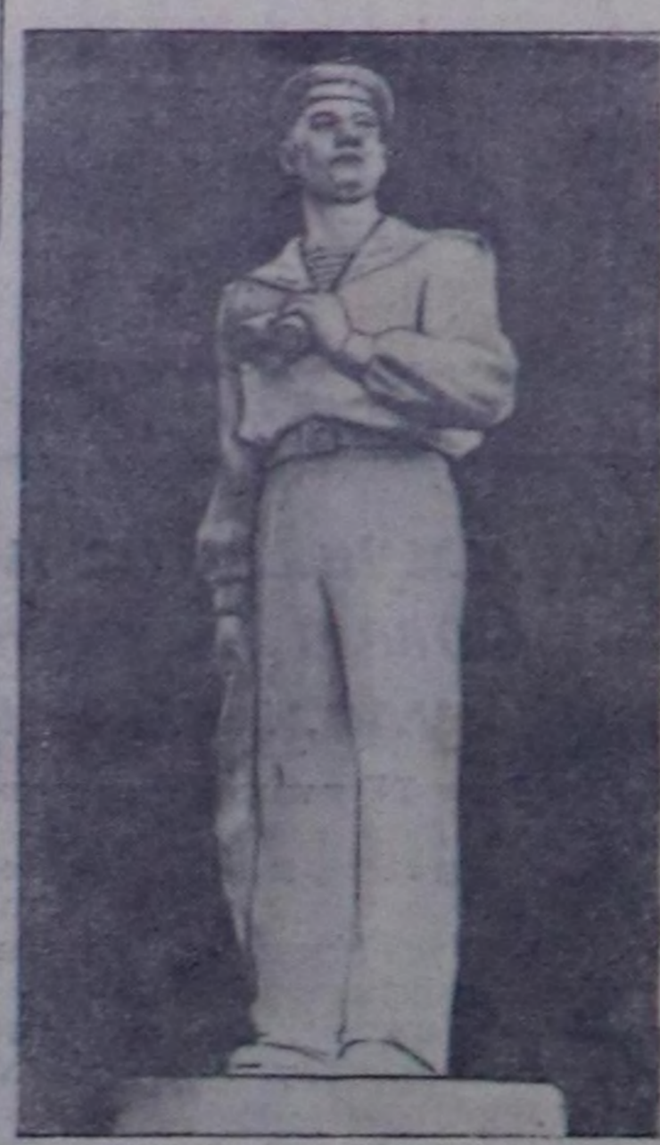
Бо чылын Кызылдын дыштанылга паркында «Далайжы», «Аныяк Суворовчу», «Бичин партизан» деп скульптураларын тургускан. Чуртка «Далайжы деп скульптура. Чуруу С. Феоктистовуу.

Совет улус ам Коммунист партиянын революстог теориясы-биле чепсегелген, ажылычанын агыннын сорулгаларын ботандырар турар. Совет улус ам Коммунист партиянын революстог теориясы-биле чепсегелген, ажылычанын агыннын сорулгаларын ботандырар турар.