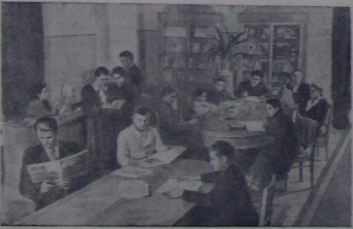
Краснодарда крайның Башкылар бажыңа ажытыңган. Хоорай чырыдышкынынын үш муң ажилдакчылары чаа чаагайжыдыр туттуңган клубту алган. Ол номчулга болгаш көрүкчүлөр залдар- лыг, дыштанылга комналыг, 1000 олуттуг парк болгаш чагы театрлыг. Чурукта: номчукчулар залы.

Чамдык бүдүрүлгелерде социали- стик чарыштын удуртулганында чет- пестери пленумга шүгүмчүлгөн. Профэвилелиниң ТК-зынын плену- мунун үндүргени доктаалда чинк болгаш аш-чөм үлетпүрүнүн ажил- дакчыларынын мурунун партияның болгаш чазактын салган сорулгалары- нын чедишкениг күүселдези дээш социалисттик чарышты улам ыңай калбартырынын талазы-биле хемчеглерни айткан.