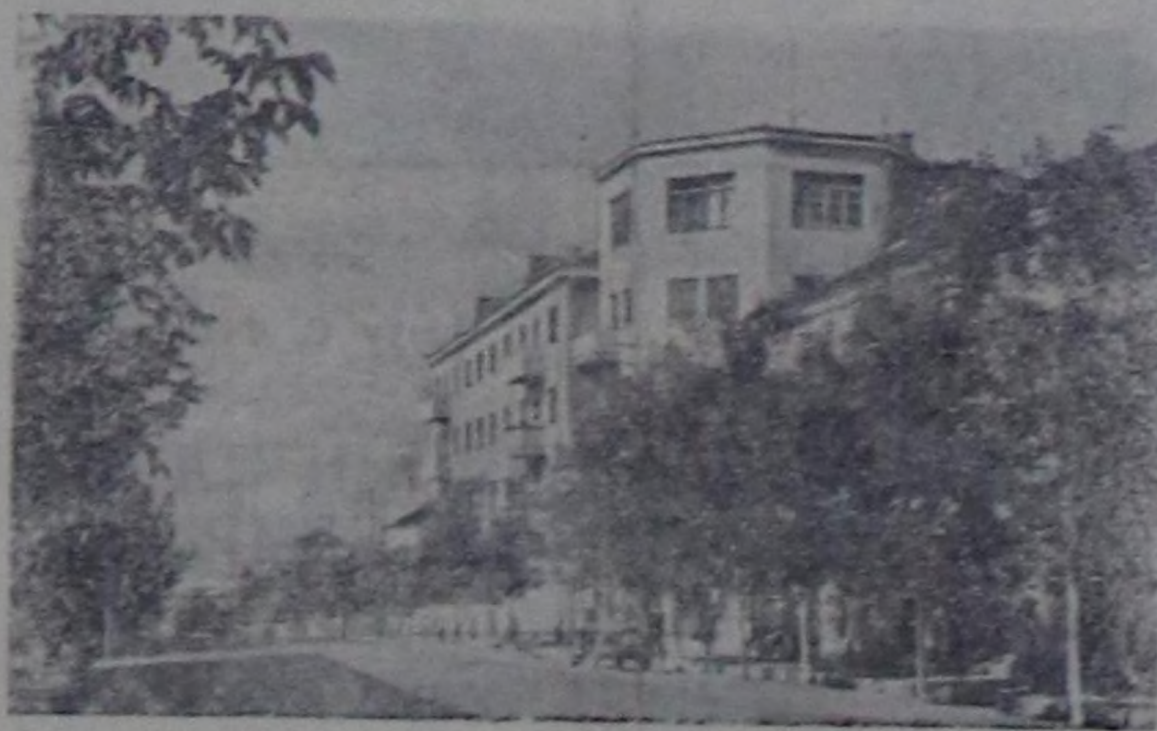
Калуга. Сталин кудумчузу.