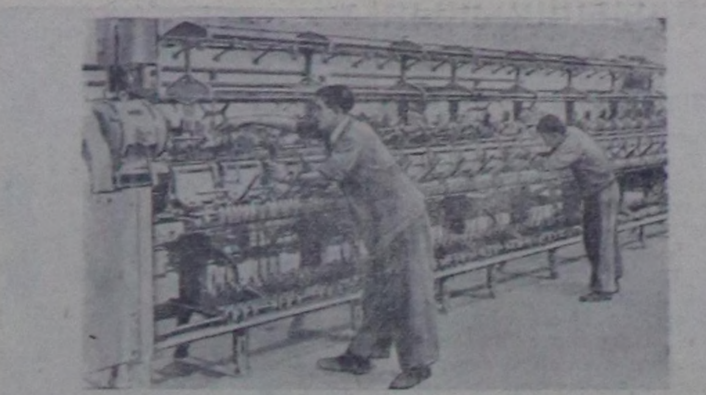
Албания. Тиранада бо чылын дүк кылыгыг пөстер фабриказын тудуп турар. Совет Эвилелинде алдынган станоктарын ам таарыш- тыр тургузуп эгелээн. Фабриканы ажылдап кийрген соонда дүк кылыгыг пөстер-биле чурт бүрүн хандырттылар.