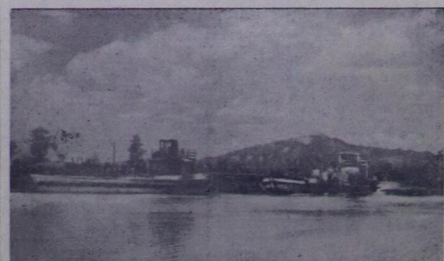
Чурукта: Чаа-Хөл районун төвүндө пароход доктаап турар черде.

(«Правданын» август 15-теги мурунку чүтүг).