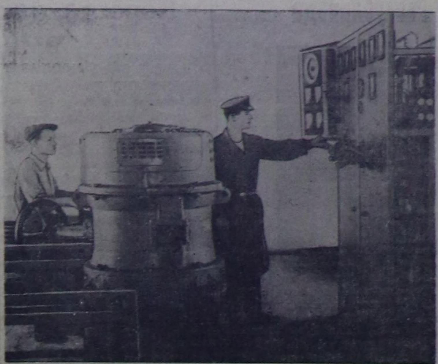
Чөөн-Хемчик районун Сталин аттыг колхозунун сут күжү-биле ажилдаар электри станциязынын тууду доозулган. Чурукта: станциянын иштики хевир.