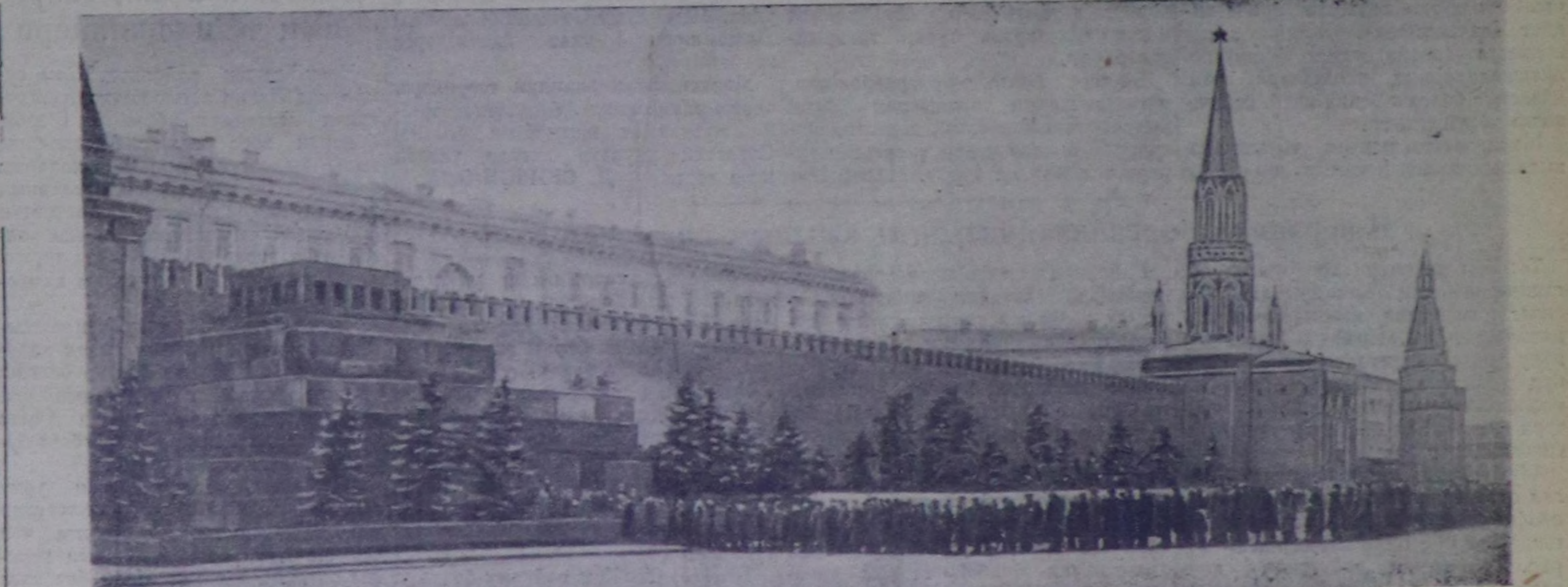
Владимир Ильич Ленинниң Мавзолейи.

В. И. Ленинниң шыңгы херээниң уламчылакчызы, бүгү делегейиң ажылчы чоннарың ынак баштыкчызы болгаш башкызы, тайбынның улуг тук тудукчузу И. В. Сталинга чорудар байырлыг чагааны хуралды киржикчилери улуг сорук киришкени-биле хүлээп алган.