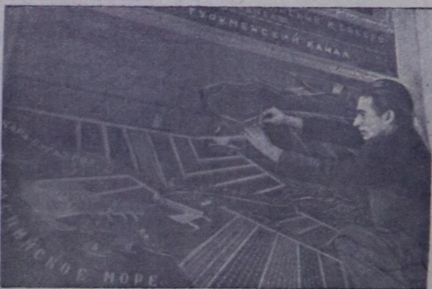
Областың чурт музейиниң социалисттиг тургузушкун салбырынын залында коммунизмниң уаг туугуларынын дугайын көргүзүп турар монтажы чоокта чаа кылып дооскан. Музейиниң ол чаа көргүзүлгелерин 5 муң ажыг кизи көргөн. Оон иштинде 52 экзюсия болган.

Чурукта: чурукчу Г. Грошев Кол Туркмен каналдын македия Чуруу А. Ермолаевтин.