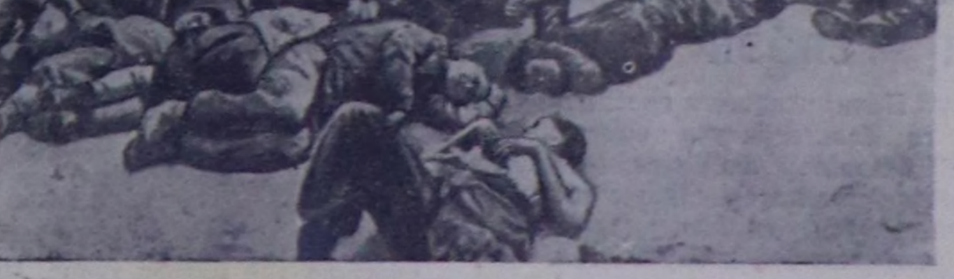
Мурнуу Кореяда Кочжедо ортудукта №76 лагеринин секторунда турган шериглерни американнарнын ханныг аажылаашкыны.

«Дейли уоркер» солунун дипломаттыг тайылбырлакчызын медээлөп турарын эзугаар аларга