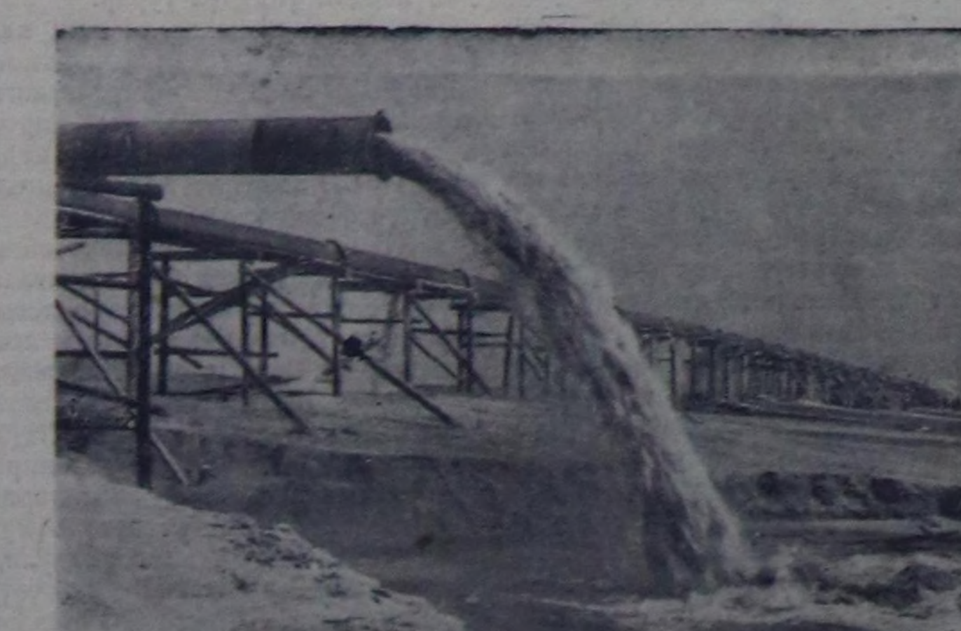
Сталинградгидрострой. Сталин градтын суг күжү-биле ажилдаар электри станциязынын тудуунун адаандан довракты үндүр касышаан, оон-биле кады суг чире какапсы-биле чадап кыдып турар күчүлүг чер казар машинанын ажилдап турары. Чуруу А. Маклецовтуу. СЭТА-нын прессклишези.

Чурукта: Н. Ковешниковтун мотор чанында ажилдап турары. Чуруу А. Ермолаевти.