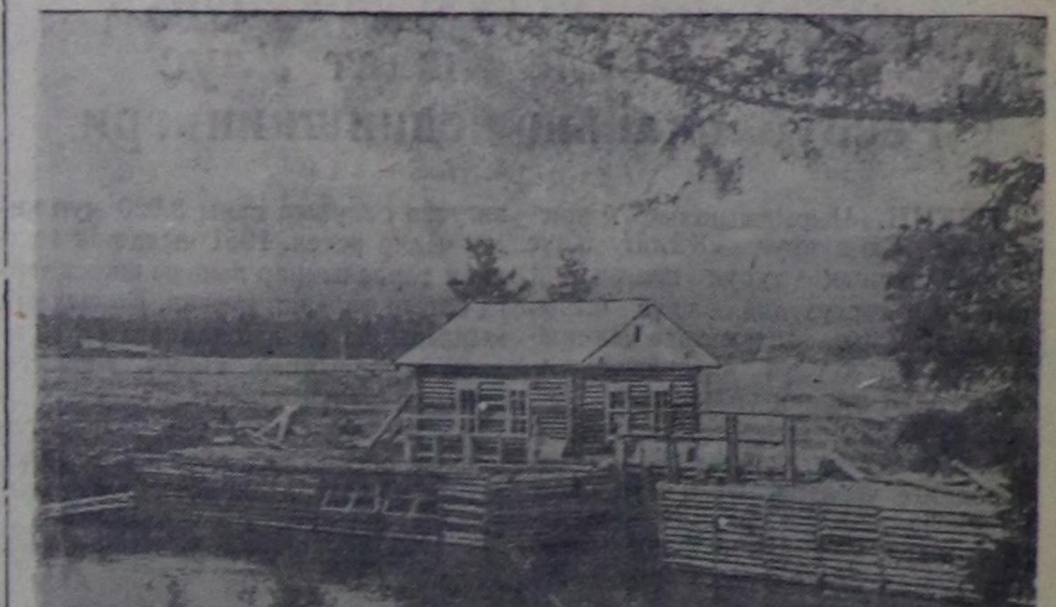
Тоюу районда колхозтар аразынын электри станциясын тудуп турар. Ооң күжү 80 киловатт. Ол станция тутунган соонда Тоюунун колхозтарына Ильянин лампазы хып эгелээр болгаш электри күжүн колхозтар будуруул гелеринге калбаа-биле хереглээр.