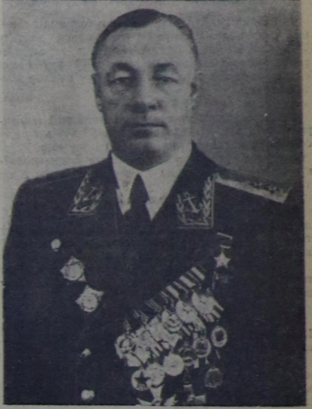
ССР Эвилелиниң Шериг-Далай Министри Вице-адмирал Н. Г. КУЗНЕЦОВ.