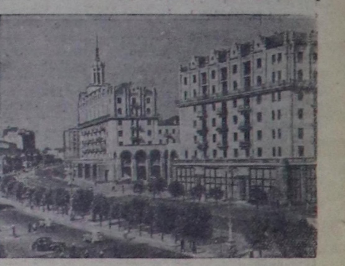
КИЕВ. Крешатикада чаа туттуңган хөй кагытарлыг бажы.