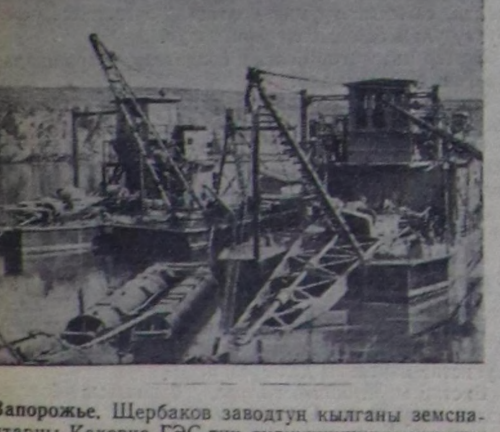
Запорожье. Шербаков заводтуң кылганы земснарядтары Каховка ГЭС-тин тудушкунунче чорудуп турары.