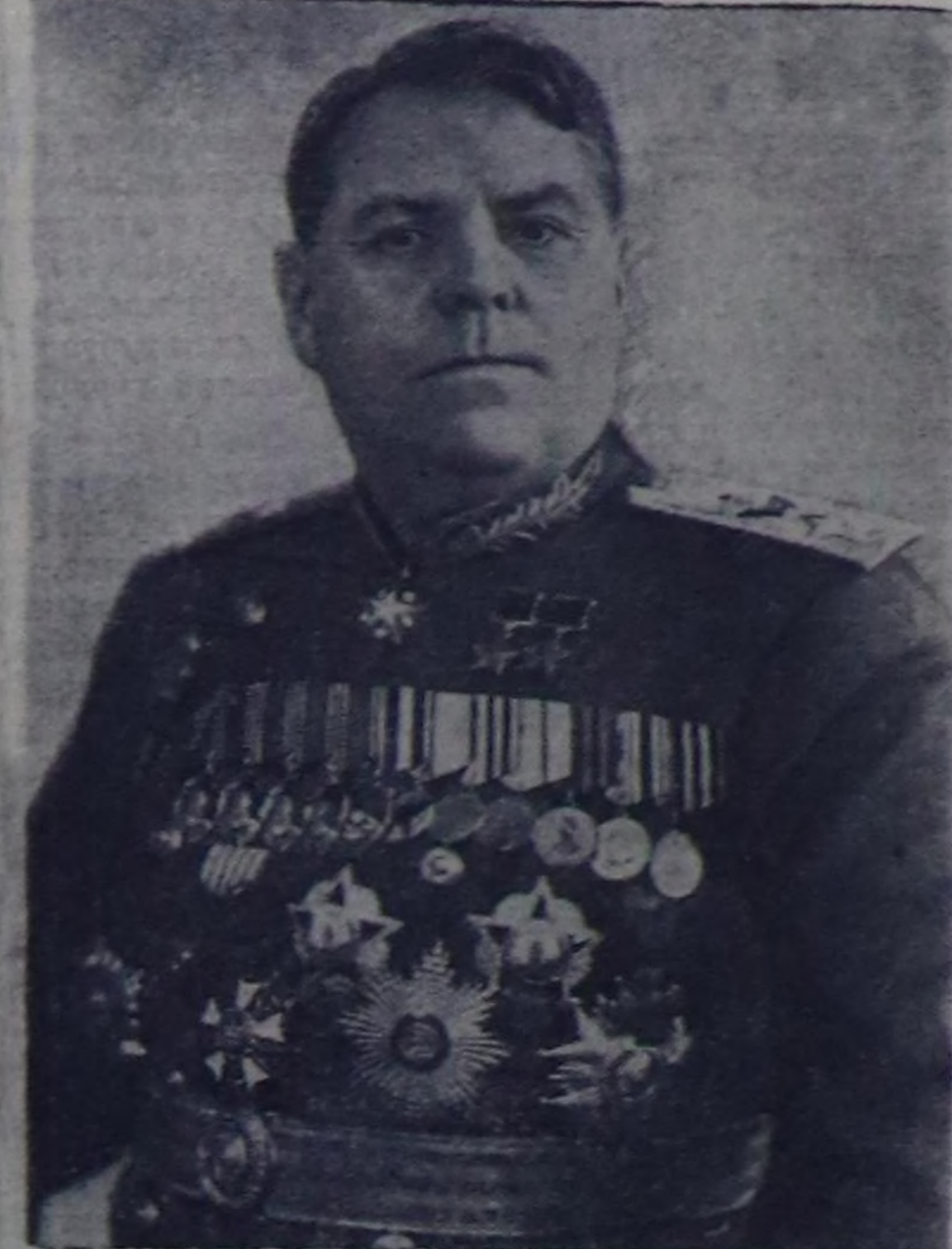
Совет Эвилелиниң Шериг Министри Совет Эвилелиниң Маршалы А. М. ВАСИЛЕВСКИЙ.