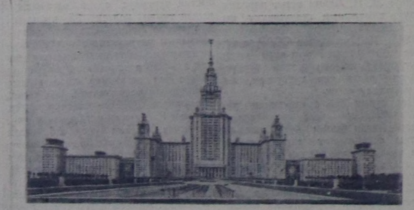
Ленин дагларында Москваның күрүне университетиде. Чуруу А. Грановскийниң болгаш Н. Кулешовтуу. СЭТА-ның прессклишези.

МАЛГАШТАЛГАН ЧЕРЛЕРНИ АЖЫЛГАП ТУРАРЫ УЖГОРОД. Закарпатьеде көдээ ажил-агый чылынын баштайгы түнелдерин үндүрүп турар. Берегов округунун колхозтарында көдээ ажил-агый артельдериниң хөй кезин хову ажылындан миллион-миллион орулгалары алганнар. Малгаштан чаалап алгаш, ажиллап эгелээ черлерден тараанын, мал чеми болгаш техниктиг культураларының база дээш чылда чемиштик үнүштериниң бедик дүжүдүн ажаап алган. Чаа ажиллап черлерде тапкы тараан колхозтар миллион-миллион орулгалары ап турар. Хрушев ат-тыг көдээ ажил-агый артели чылда тапкынын ийи дүжүдүн ажаап алган. Оон түнелинде ол культураны тараан бир гектар чер бүрүзү 50 муң рубль ажыг орулгалы берген. Тапкы ажылындан алган ниити акша орулгалы бүдүн чартык миллион рубль чедип турар. Партияның XIX съездиниң директиваларын боттаңдырышсаан, округтун тараажылары малгаш шыпкан турган черлерни ниитиниң байлаан көвүдөдириниң үнер курлавыры кылып турар. (СЭТА).