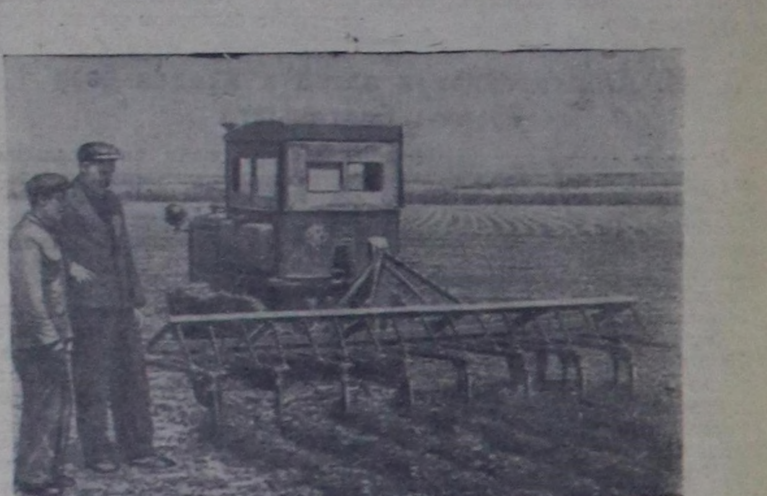
Краснодарский край. Ново-Кубанский района Кубанын күрүнени зоналыг машина-шылгалда станциязы көдөз ажал-агынын чаа хевиринг машиналарынын шылгалдазын чорудуп турар. Чурукта: КПН культуторуну шылгап турары.