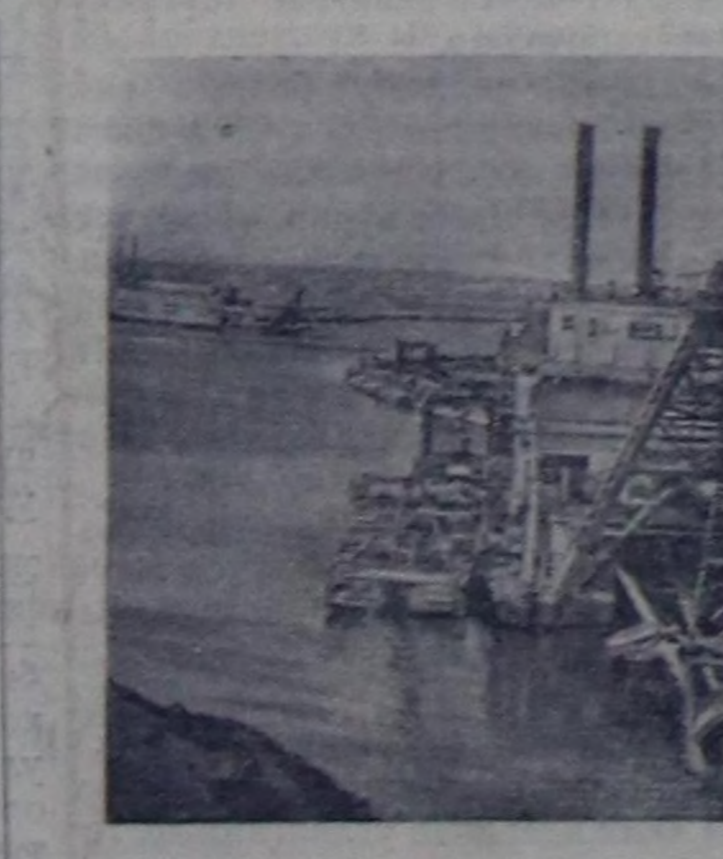
Куйбашгидрострой. Суг күжү-биле ажилдаар электри стан-циязынын тудуунун алаанда онгарнын уун күчүлүг дөрт земсна-рядтар казып турар.

Чурукта: онгарнын уун казып турар земснаряд.