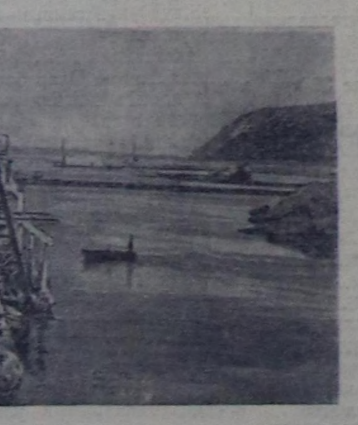
Дээрбелерге болгаш элеваторларга чаа машиналар

Чурукта: онгарнын уун казып турар земснаряд.