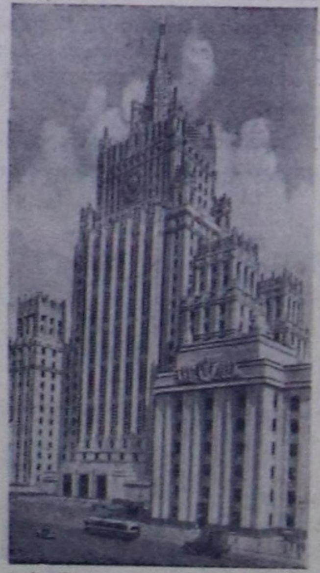
Москва. Смоленск шөлүндө бедик бажын.

Чуруу А. Грановскийни. СЭТА-ның прессклешези.