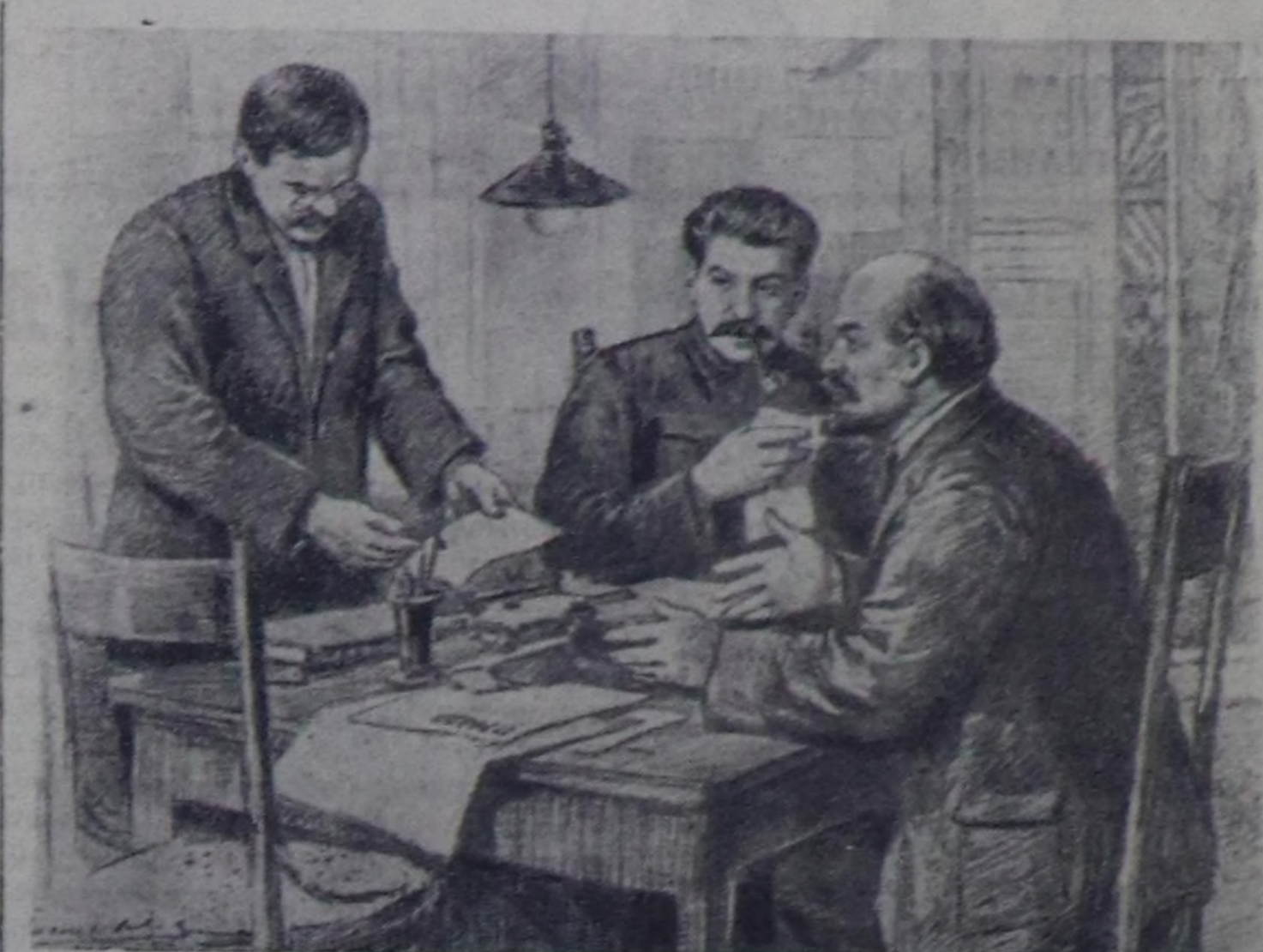
В. И. Ленин, И. В. Сталин болгаш В. М. Молотов 1917 чылда «Правда» солунун редакциясында

40 чыл бурунгаар, 1912 чылдын майның 5-те массалык большевикчи солун «Правда» бир-ле дугаар чырыкче үнген. Ол болза, В. И. Ленинни айтышкынынга үндештирилген, И. В. Сталинни инициативазы-биле болган. «Правданын» үнгенин соон дарый Ленинни бижээни болза: «Петербургтун ажилчыннары хүн-бүрүнүң ажилчын солунун тургускаш, хөөредип чугаалавакка безин улуг херекти бұдүрген» (В. И. Ленин, Чог., т. 18, арын 166). «Правданын» 1-ги дугаарынын үнген хүнү майның 5-жи большевик парлалганын байырлалынын чачыл болган хүнү апарган.