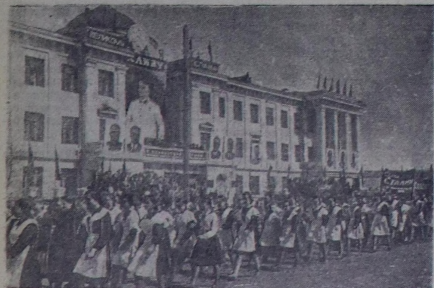
Ажилчы чоннарның бүгү делегей байырлалы—Май 1-нин чыскаалы Кызыл хоорайга улуг көдүрүлүшкүнүң эрткен. Чурукта: Кызылдын школачыларынын чыскаалда колонназынын эрттип турары.

Май 1-де район төвүнге күш-культураның яны-бүрү маргылдаалары болган.