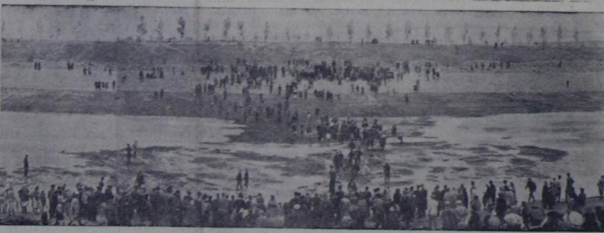
1952 чылдың май 31-де Волга-Дон каналының бирги шлюзу биле ийги шлюзуңуң аразынга Волга биле Доннуң суу катышкан. Чуруу С. Кроповниктиин.