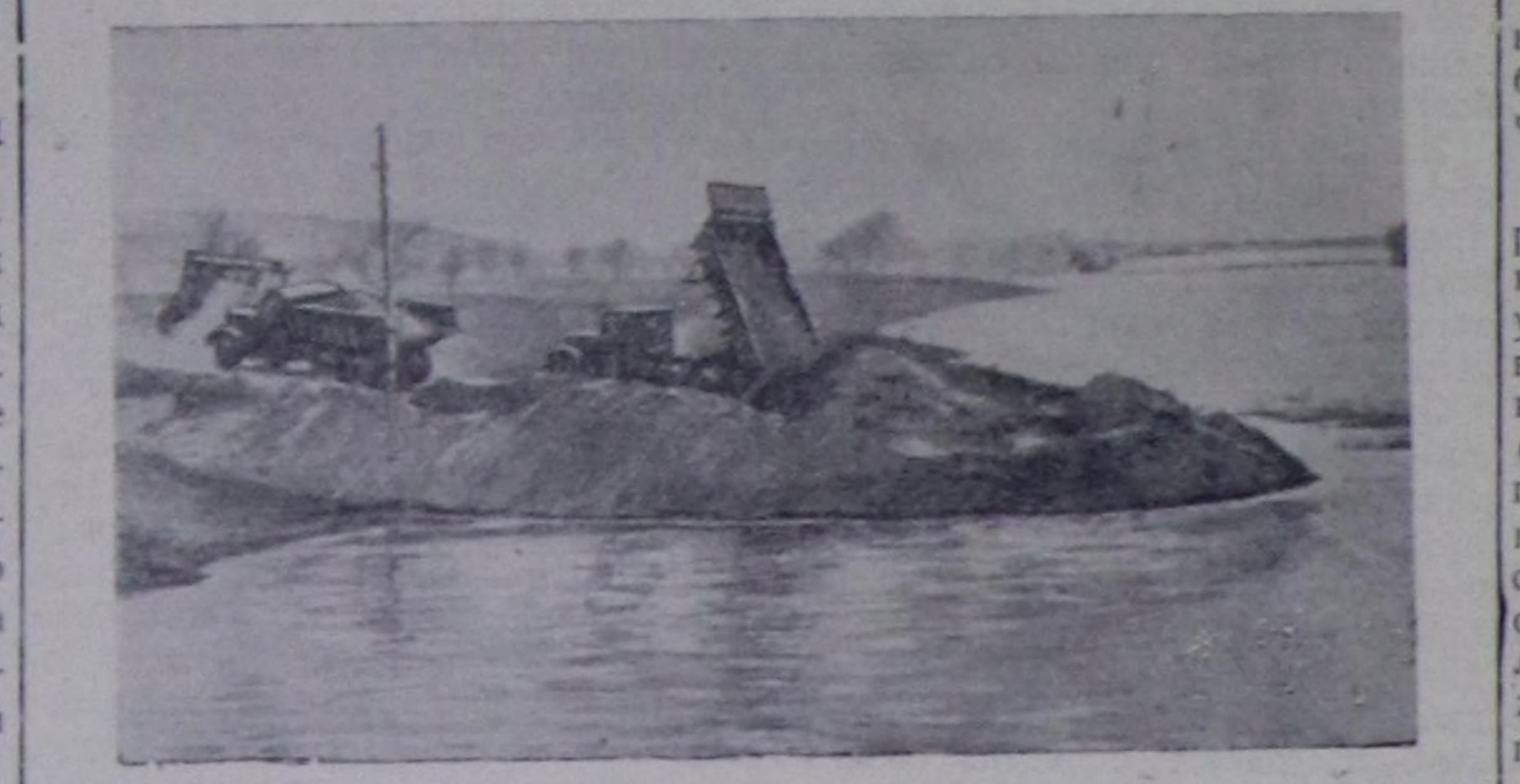
Сталинграддогу тудугнун кол онгарынын үстүкү кезиниң чадалаынын кылып турар. Чурукта: довурак сөөртүр машиналарың чүгүн дүжүрүп турары.