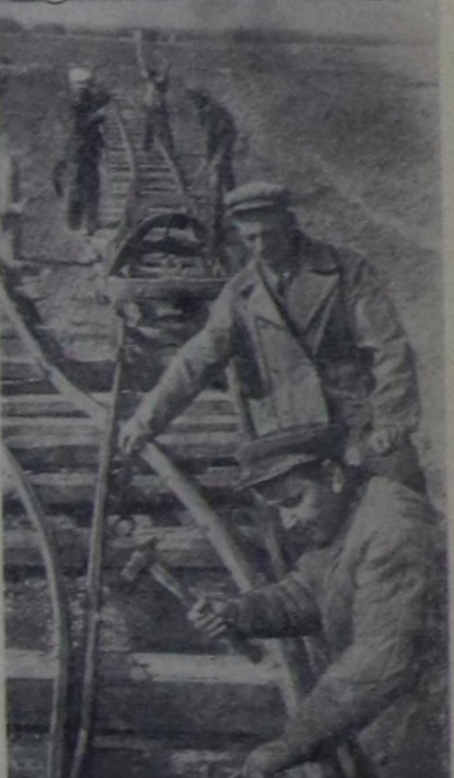
Краснодарский край. Марьянский районун «Память Ильича» колхозунда механизасчтыкан тууубу-черепица заводун тудуп турар. Ол завод чыда бөдүн чартык миллион тууубу болгаш 150.000 кезек черепицаны кылар.