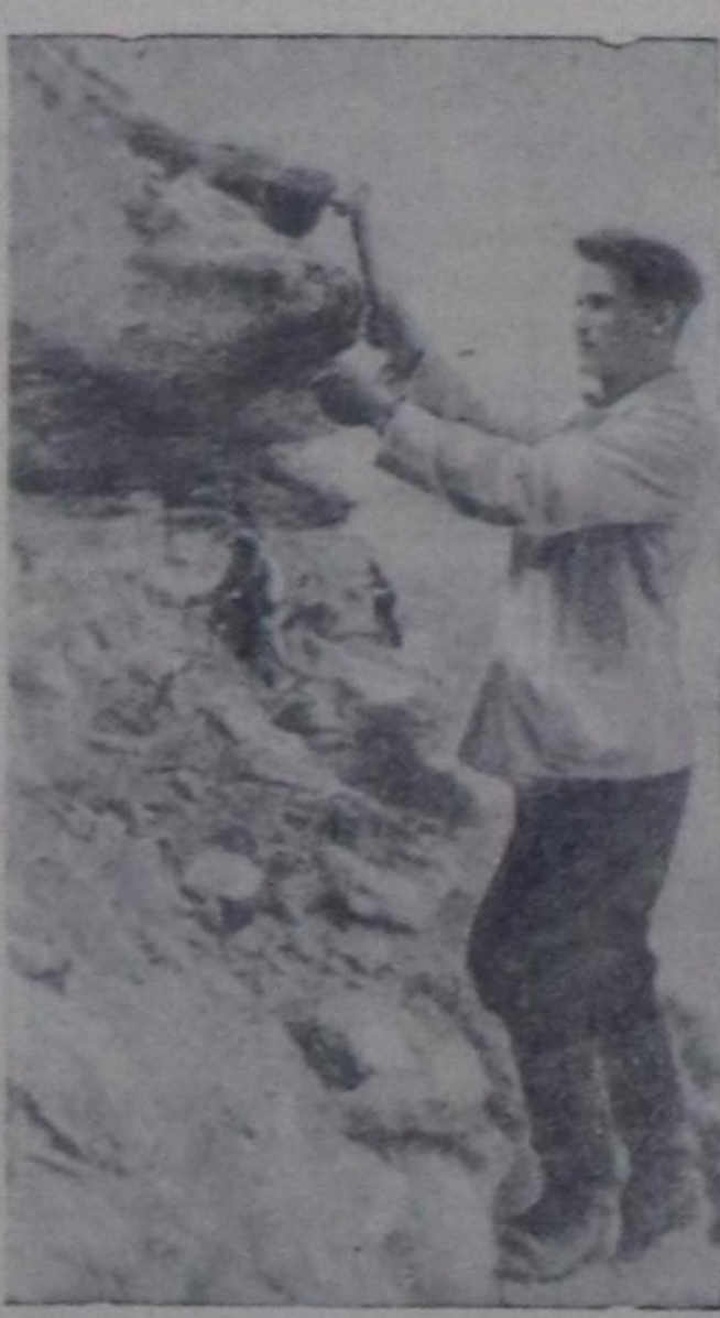
Туркмен ССР. Гидропроектиниң составында кирип турар Куртышскийниң инженер-геология отряды Кол Туркмен каналдың Мурнуу-Барың кезэиң шинчилеп турар.