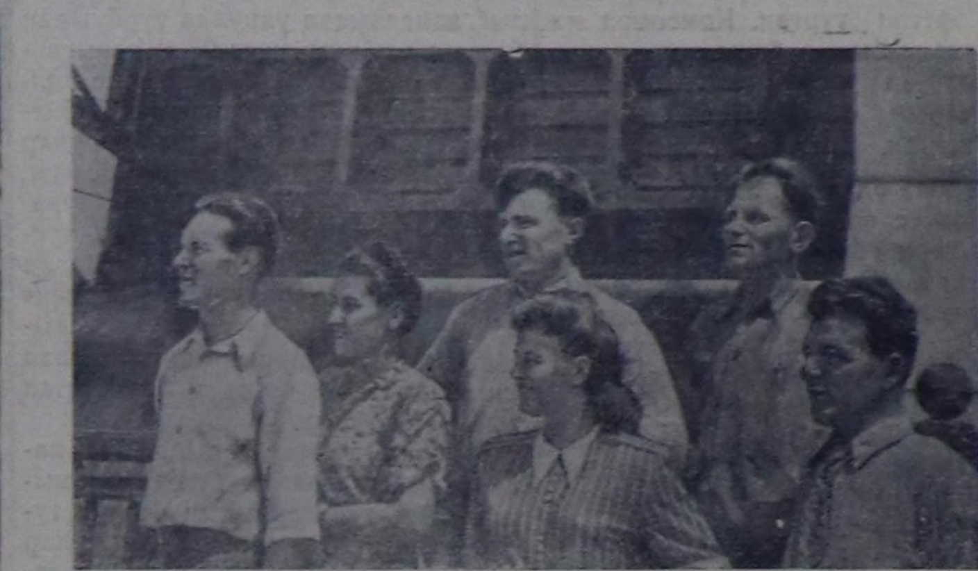
Ростовская область. Цимлянская суг күжү-биле ажылдаар электростанциязы июль 6-да бирги токту берген.

Хэй кижикиржикчилик митингилер кокс-химия заводунга, «Центральная» деп шахтага болгаш областың өске-даа будурүлгелеринге болгулаан. (СЭТА).