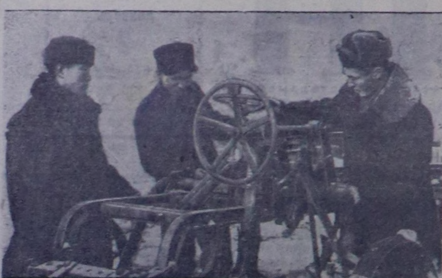
Областың колхозтар даргалары белеткээринин талазы-биле көдө ажал-агынын ортумак школазы чылдын-на он-он кадрларны колхозтарга белеткеп үндүрүп турар.

Бо өөредилге чылдыда областың колхозтарындан дыка хөй кижин өөренири-биле келгенер.