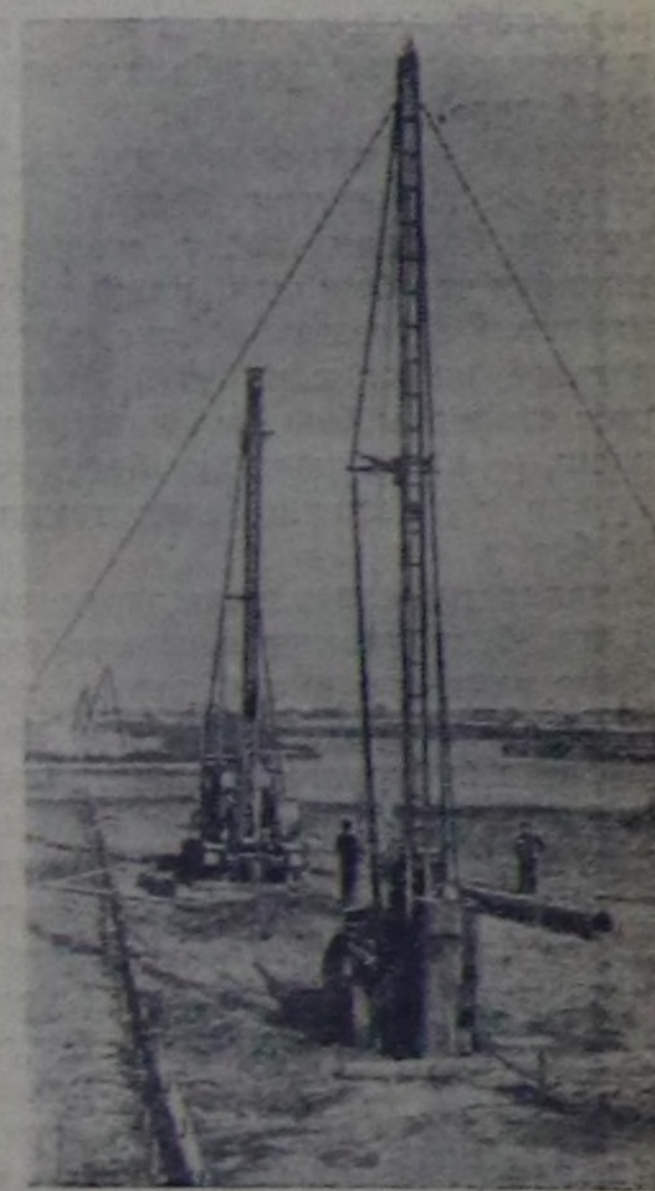
Каховканың суг белдир. Тудушчулар суг оруунун шлюзуңу адаандан довурак үндүр казарын дооскан, аага бетон болгаш арматура салырын эгелдери-биле оон сугуңу үндүр сордуруп эгелээн. Чурукта: суг үндүр сордуруп турар аялдын участогу.

Бо чылдын Калининград областа 12 медицина албан черлери ажытынган. Чүгле лаборатория дерилгелерин, эмнегеленин аппаратуралары, рентген тургузушкунун садып алдырынга 11 айларын дүзүзүндө миллион аялгы рубльди чарыдаан. Чеди чыл туруп турарынын дүзүзүндө областа, оон хоорайларында болгаш суурларында 62 эмнегелер черлери, 400 хире фельдшер-акушер пунктулары, диспансерлер, божуу бажынар, консультация черлери болгаш медицинанын өске-даа албан черлери ажытынган. (СЭТА).