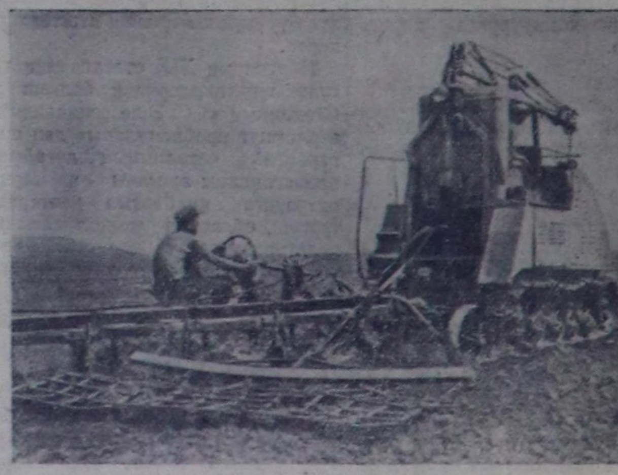
Украин ССР. Киев областын Корсуй-Шевченковский машина-трактор станциязынын электрлиг тракторунун күсүкү чер андарып чоруруу.