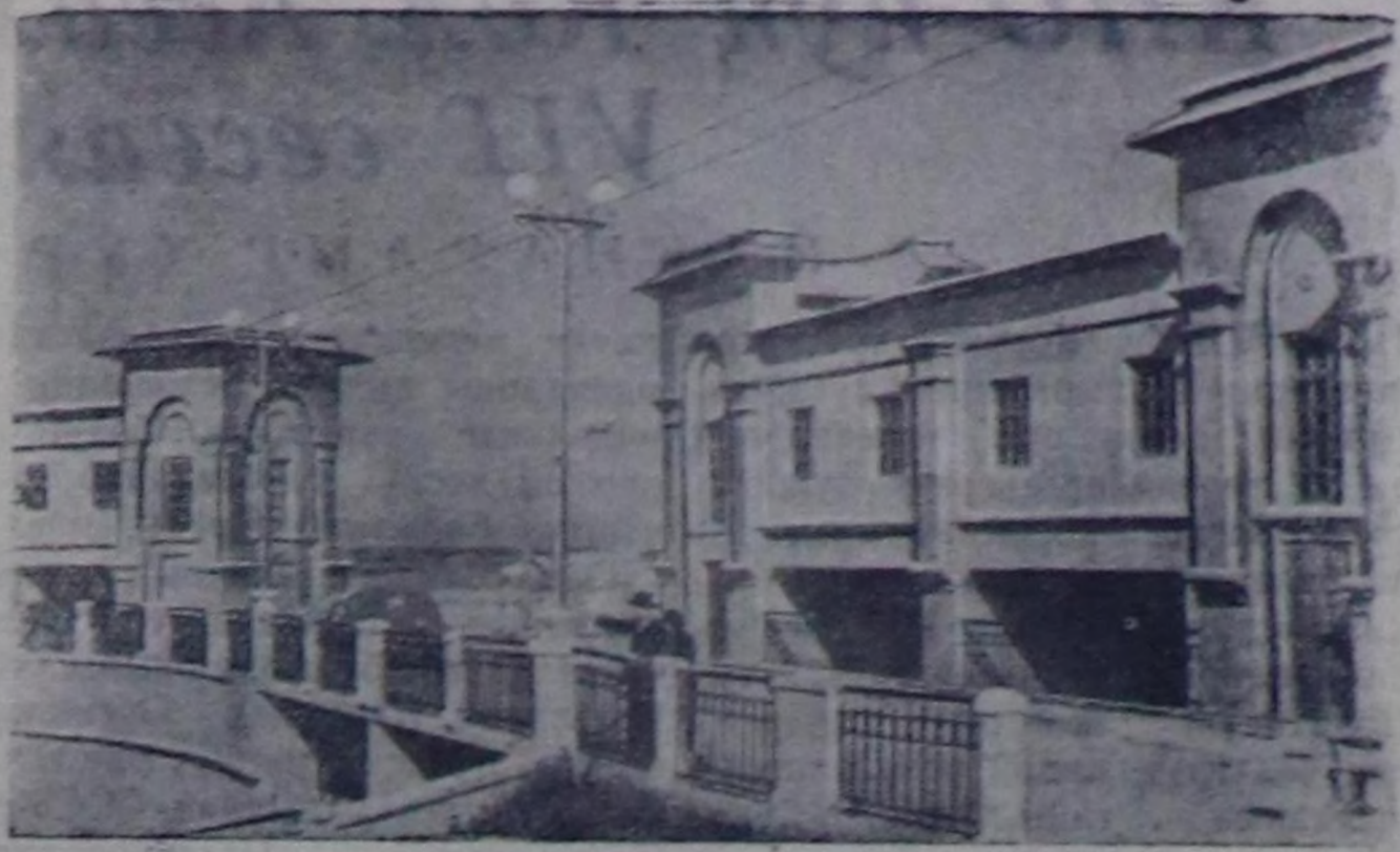
Ставрополь край. Кубань-Егорлыкский суггарылга системанын тудуунда. Чурукта: Право-Егорлыкск каналының башкы шлюзу.