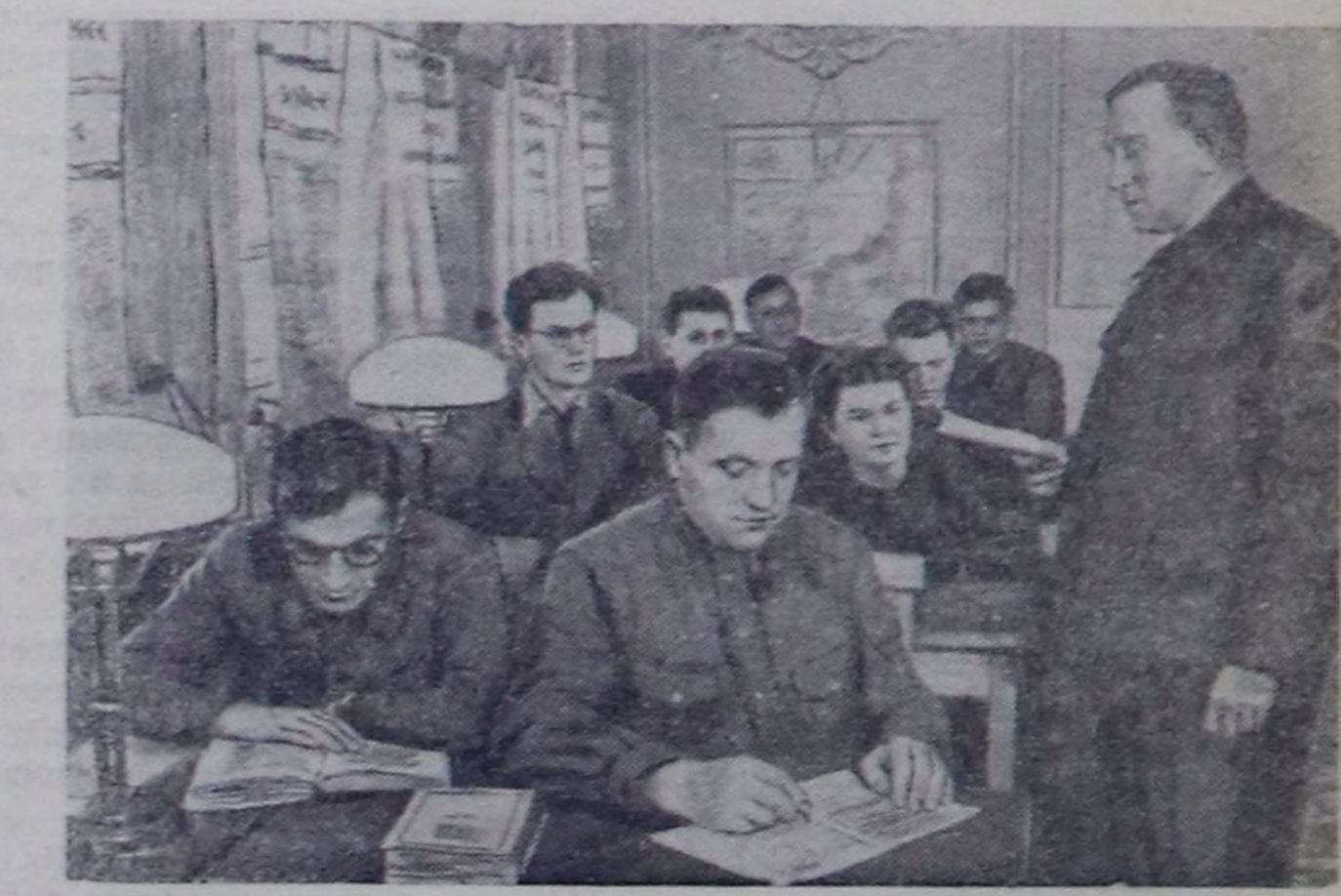
Украина ССР. Жданов аттыг коксохимия заводунуң партиябинеди чокта чаа эки бажыкче кошкен. Чурукта: экономика айтырыгыларын өөренир семинарның удурткучузу (оң талазында) чаа партиябинетте консультация эртирп турар.