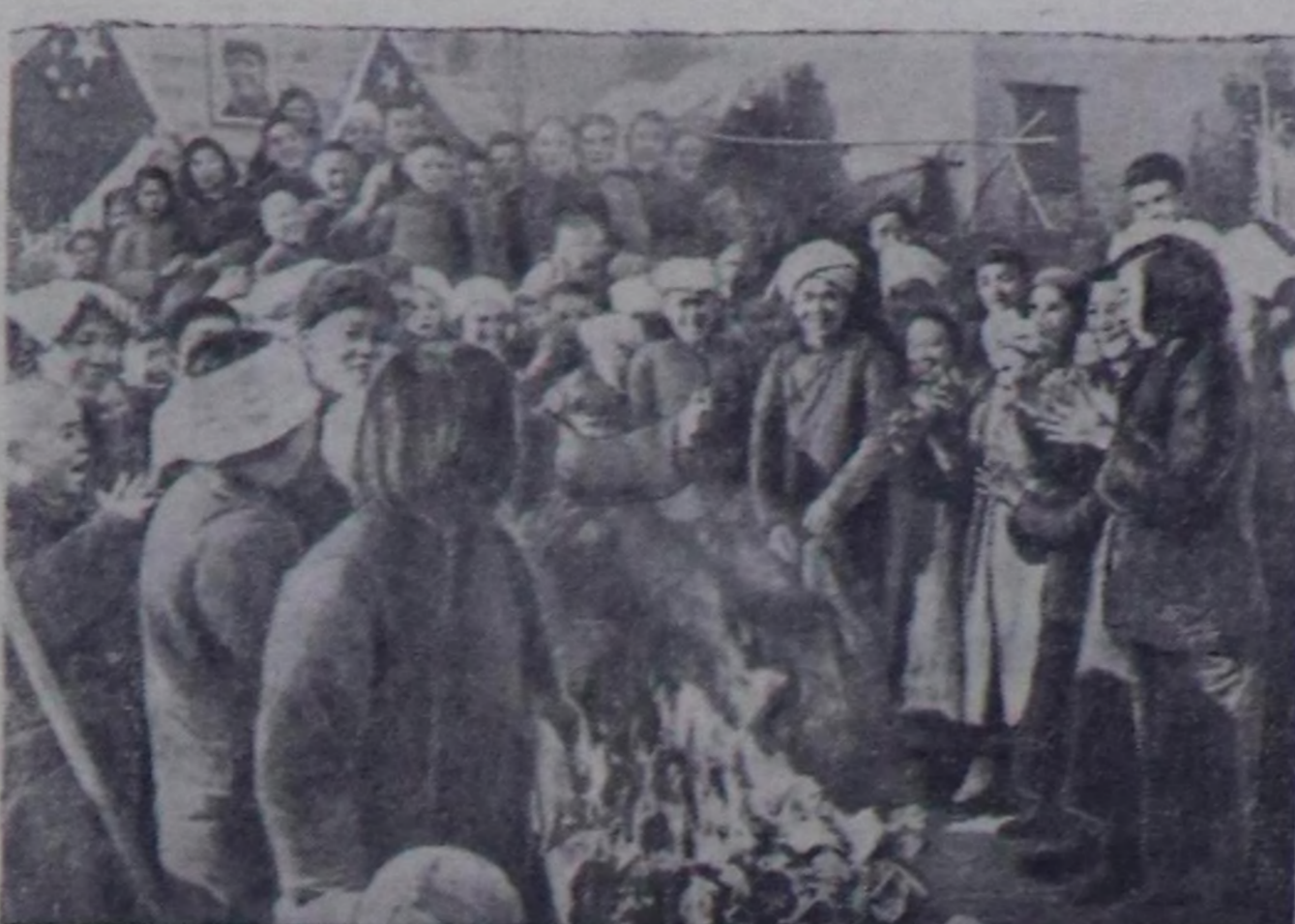
Кыдаттын Улустун Төп чазыа чер реформазын чедишкнниг чорудуп турар. 290.000.000 чурттакчылык черде чер реформазы чорударын дооскав.

Черни сайзырадырынга Улустун Төп чазыа тараачыннары көдээ ажыл-агыйның янзы-бүрү чепсектери, өдөкшидилге болгаш үрзинвер-биле хандырып турар. Дыка хөй көдээ суурларда дузалачы бөлүктөрүн тургускав.