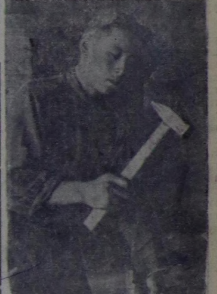
Сүт-Хөл МТС-тин дарганы М. Ортунак тайбынның стахановчу ээлчээнде туруп, кончуг эки күш-ажыл-биле тайбынның херээңге быжыглап турар.

Чурукта: Күрүнениң академиктиг Биче Театрында, Кыйгырының адаанга улустун артизи И. В. Ильинскийниң ат салып турары. Чуруу А. Батановтуу. СЭТА-ның прессклишези.