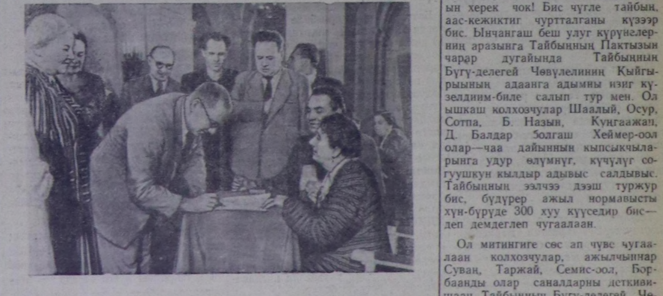
Москва. Беш улуг күрүнелерниң аразында Тайбынның Пактызын чарар дугайында Тайбынның Бүгү-делегей Чөвүлелиниң Кыйгырының адаанга ат салышкынының чыылдазы бистин Төрзөн чуртувуста үргүлчүлөп турар.

Ол ышкаш Чадаананың үлегерлиг станциязында стандарттыг бажың тудуп турар комбинат ат салышкыныга холбаштыр алган социалисттиг хүлээлгезин алдарлы-биле күөседип турар.