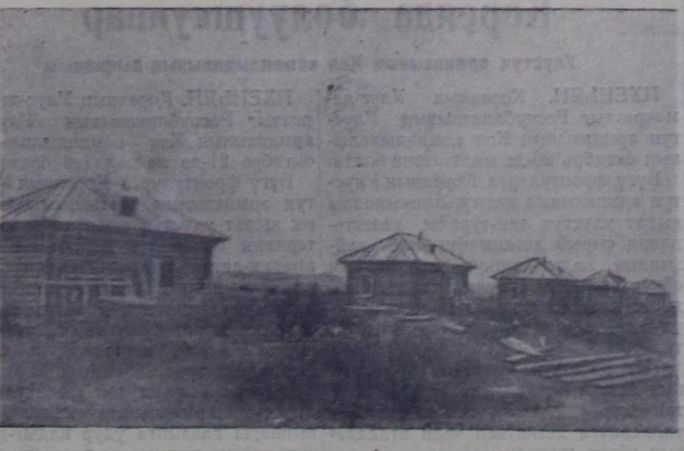
Бистин областа бирде дугаар күрүнеин чылгы ажылынын кажазын тургузуп турар. Амгы үеде Чөөн-Хемчик районда күрүнеин чылгы ажылынын кажазынын тудуглары болгаш чуртталга бажынарынын тудуу түлүктөп турар.

Чурукта: Чөөн-Хемчик районда күрүнеин чылгы ажылынын кажазынын ажилчы суурунун тудуу.