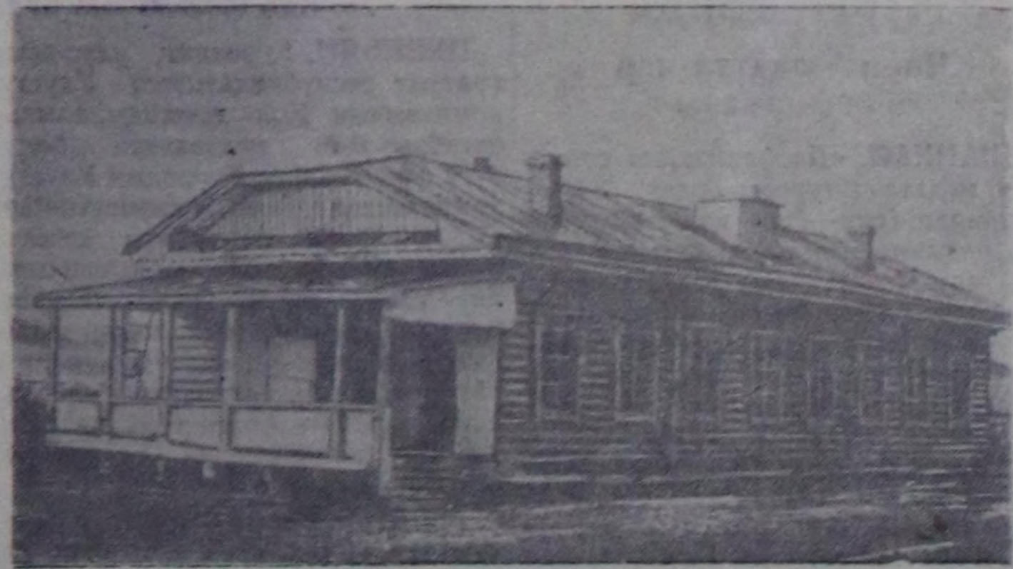
Бистин областың районнары, колхозтары чаа-чаа тудуглар-биле чылдың-на немежиң турар.

«Бүгү чурттарнын революшчулары боттарынын карачангыс ала-чурту ССРЭ-де деп сананышаан, бүгү делегейин ажылчы чоңарынын хосталгалыг демселчинин оода ССРЭ-же идегал-биле көрүп турарлар — деп эш Сталин бижип турар. Бүгү чурттарнын революшчу ажылчылары совет ажылчыны адгыга, хамыкты мурнунда өске чурттарнын пролетарийлери чору-