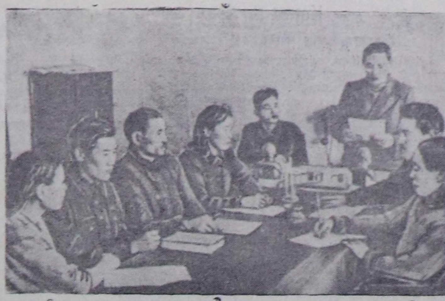
Март айның эгезинде Кызыл-Мажалык суурга «Чаа амыдырал» солунун номчукчулар-биле конференция болуп өрткөн. Аңаа номчукчулар боттарынын санал-онадларын берип, район солунунун ажылын моон сонгаар улам эки-жидип чорударынын дугайында боттарынын сүмелерин бергенер.

И. МИХАЙЛОВ, РСФСР-ниң Министрлер Чөвүлениниң чанында көдэз тудугунун Кол эргелдениң начальнигиниң оралакчызы.