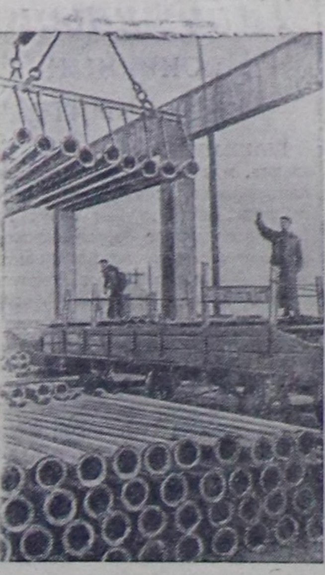
Сталинград область. Макевскийның Куйбышев аттыг хоолой заводу муң-муң тонна шой хоолойлары коммунизацияны улуг тулуунуң адренчине чоруткан. Ол тулунуң бүгү чагыгы хуусаа бентиде күөсетини турар. Чурукта: чыпш каан белең продукция. «Волгодонстройга» хереглээр хоолойларның чурдугулези.

ладып, малының күш чамын улгатырып турар. Бо кыжын Сарыг-Колдун кадыр-берт дагылары одар солуп үш удаа көжүп, кыш айымындан малды менди чыл ажырып, баш санын өстүрүп турар. Хойга болгаш хураганга чылыг, чырык, делгем, бедик кажаа. Хойжугу Олай бо чылын төрөөн 192 лойдан 192 хураганын камгалап алган. Ам малын Кара-Туруг тайгазынче одалдадып үндүргөн. Х. ШАРВИН.