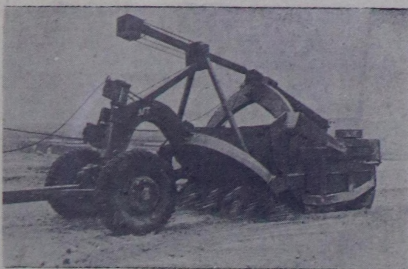
Эрткен чылын Тыванын машина-орук станциязы организастанган. Станция Тывада оруктары кылыры-биле хой чаа механизмерни алган. Чурукта: орук тудуунуң «Скрепер» деп машиназынын орук дески-леп турары.

Х. КУЛА, колхозта партия эге организация-зының секретари.