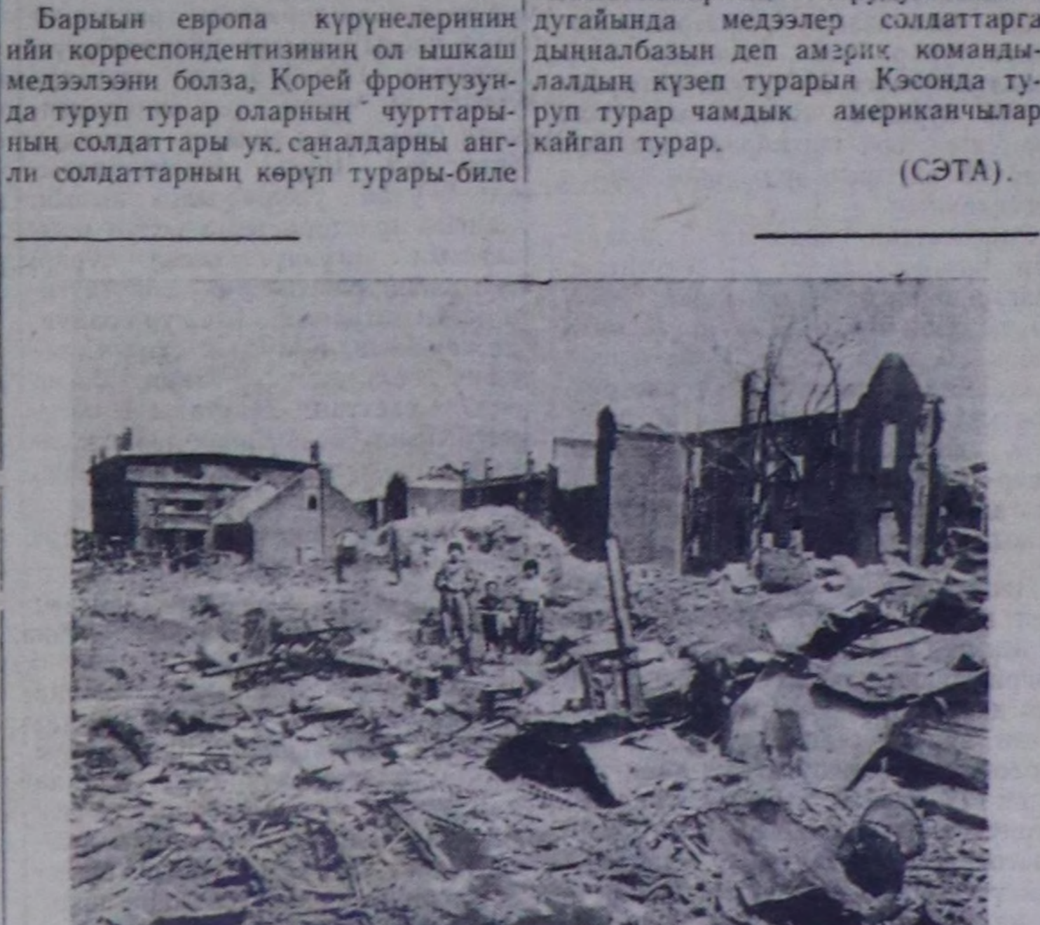
Америк ужар-чүлдүн Пхеньяне ужудушкунуңун түнөөли. Чурукта: бомбалаашкында үрелген Пхеньянын бир кудумчузу.

риглерин ажынып хорадашкынын үндүргөн. Бирини можузуңуң француз эрге- чагыргалары январьде Мурнуу Вьетнамда кезек бүрүзүндө 60—60 чаа шериглерин Сонгу Вьетнамче чорудар сорулгалыг шилеп алган- нар. Бичалза-даа, француз болгаш сатыныкчы баодайың шериглери- ниң аразына сагыш-сеткил катыш- тырылганын үндүрбүшаан, чаа ха- вырткан шериглер шыныгы удурла- нышкынын меделзөөннөр. Чаа ха- вырткан шериглерин француз ко- мандылал кара бажыче октаан. Лонг-Чау (Мурнуу Вьетнам) мо- жузуңда Три-Тау районунда ба- жынарнын үндүрткен бүгү чаа хавырткан шериглер оларны тара- дып чандыраын негээннөр. Биен- Хоаның (Мурнуу Вьетнам) саты- ныкчы офицерлер өөредир школа- зына чораан француз сержант бол- гаш ийи чаа хавырткан шериглер майда Вьетнамың демократтыг республиказының Улустун армиязы- нын талазыны кире бергеннөр. (СЭТА).