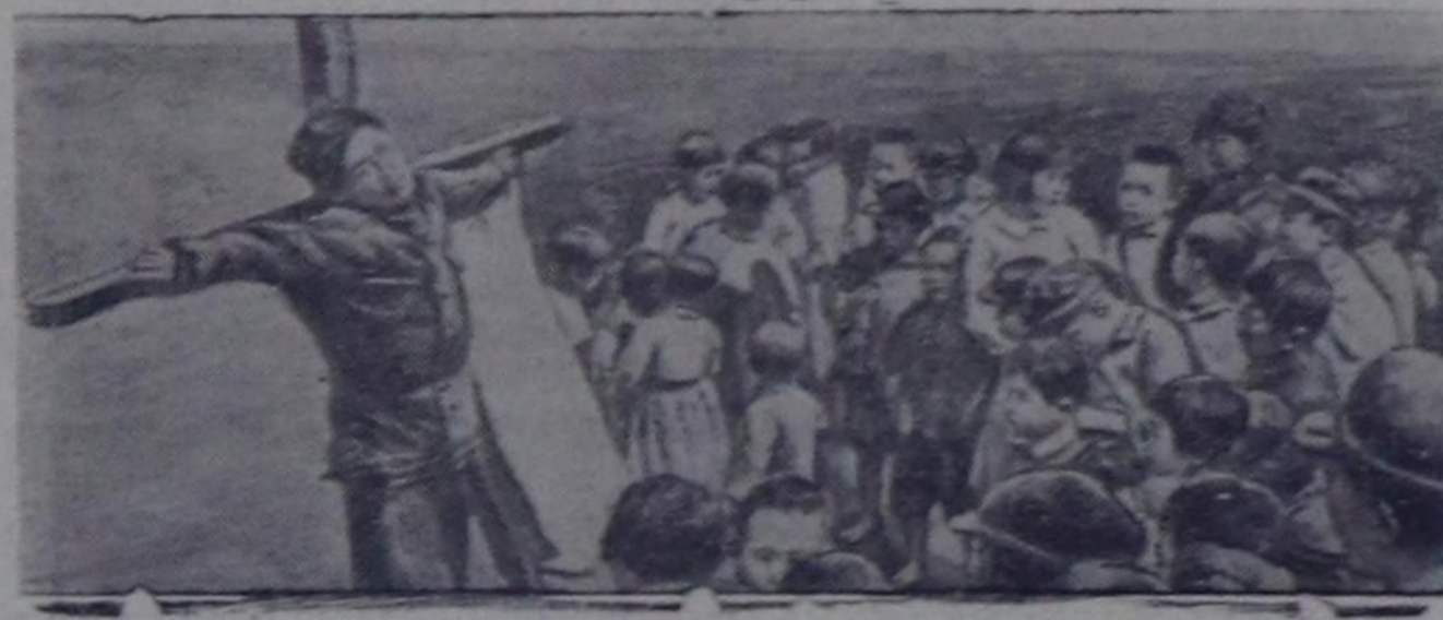
Америк интервентилер болгаш лисынманчы өлүрүкчүлөр Кореяда кончуг араатангы үлгелдиглери кылып турарлар. Агрессорларын үлгелдиг турары үргезишкн, өлүрүкчү чорук, хилинчектээшкн, черлик өзү-биле шаажылаашкн корея улустун, бүгү тайбынга ынакшылдыг кижжи төрелтетиниң чөптүг өжөзүн көдүрүп турар. ЧУРУКТА: Лисынманчыларын шаажылап кааны корея партизан.

«Нав Бхарат таймс» солун болза Индияда тайбын талалакчыларын шимчээшкннинг удуруткучуларын бирезин Китчелетин меделедин парлаан, ында мынча деп чугаалап турар: «Кореяда дайынны соксадырын негезинче тайбын бүгү талалакчыларын кыйгырып тур мен. Корея улус бодунун иштики херектерин чүглө боттары шитирлеп алыры-биле Кореядан бүгү даштык шериглери доп-дорзан үндүргөн турар ужурулу». (СЭТА).