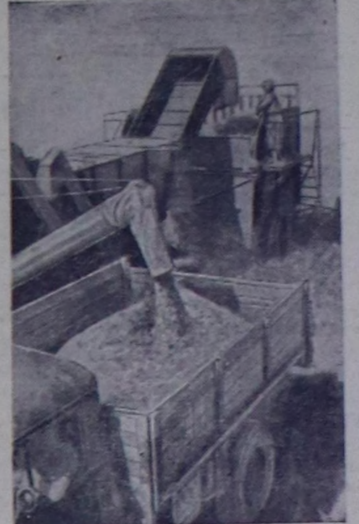
Азербайджан ССР. Ордзонкидзе аттыг тараа совхозунда чаа дүжүттүн ажаап алышкыны эгелээр. Тараа шөдлеринче 54 комбайннар үнүпкен, оларнын аразында 10 комбайннар болду кылаштар.

«Коминтерн» деп үлгерлиг мал совхозунун дуржулгазын ук Смоленск областын дыка хөй ажил-агыйлары база чедишкенин ажиллап турарлар. (СЭТА).