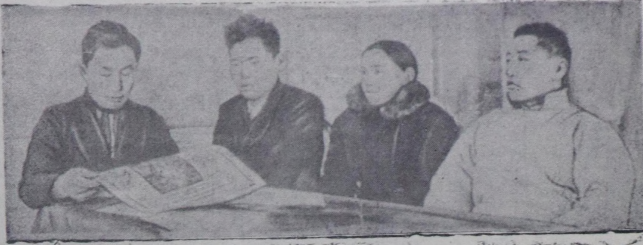
Агитпунктуда соңгукчулар-биле агитаторнун беседа чорудуп олурары.

„МТС-терниң кол сорулгалары болза, ажылдан берип турар колхозтарынга тарааның дүжүдүн бедидери, машина-трактор парктарын улам ыңай ажыглаары, трактор ажылдарының шынарын бедидери болгаш оларны агротехниктиг хуусааларда күүседире, дүжүттү өй-шаанда ажаары болгаш МТС-тин ажылы дээш натур төлөвириниң дужаалгазының планын күүседире...“