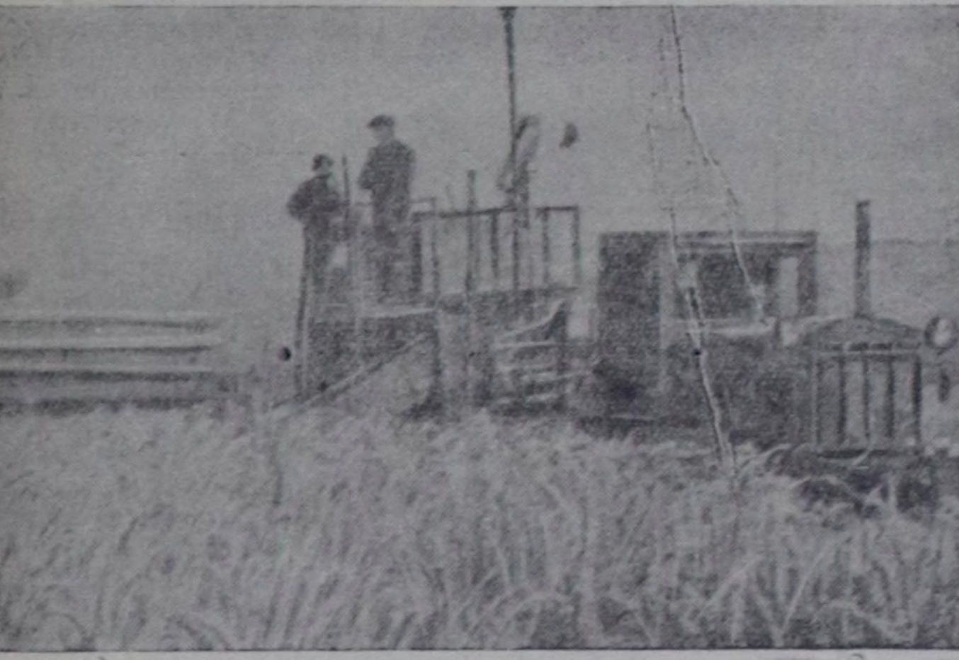
МТС-тин комбайны колхозтун тараа шөлүнге бедик дүжүт ажаап ап турганы.

1945 чылга чедир Улуг-Хем району машина-трактор станциязы-даа, чаңгыс трактор-даа чок турган болгаш тарыл-ганың бүгү шөлдөрин аъттар-биле ажылдап турган. Бир эвес МТС тургустунганының баштайгы хуннеринде МТС-ке 10 трактор турган болза, ам оларның саны үш катап өскөн. Районуң колхозтары боттарының ховуларын МТС-тин машина-лары-биле болбаазырадып турар. 1945 чылда септелгениң чаңгыс-даа дериг-херексели чок турган, ыңчаарга ам ховуларда трактор бригадаларын хан-дырып турар дарганаар 5 станоктар,