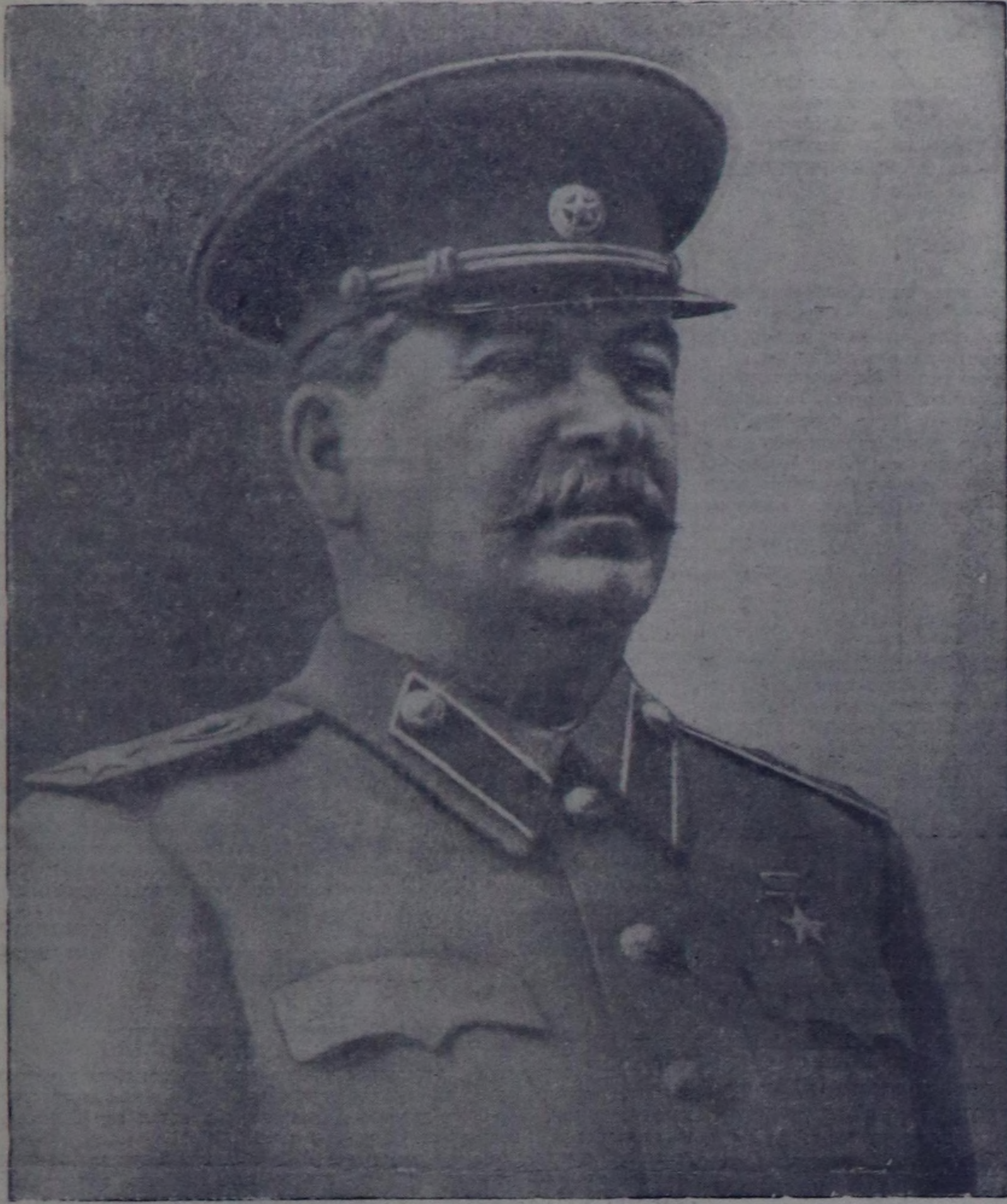
Иосиф Виссарионович СТАЛИН.