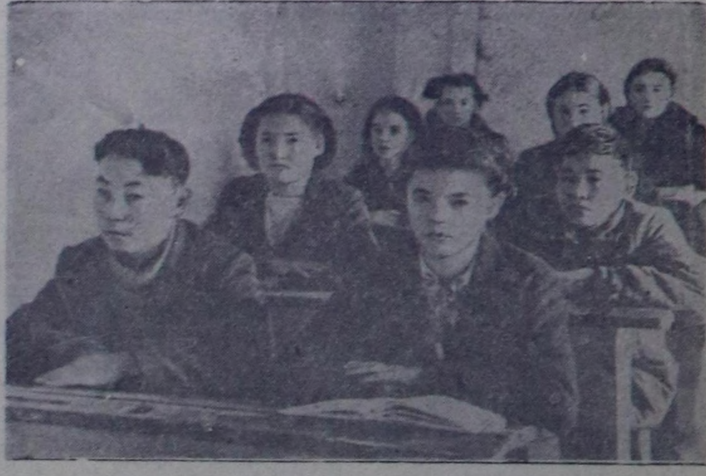
Чурукта: Чаа-Хөлдүн Кара-Тал школазының өөреникчилери кичээлде.