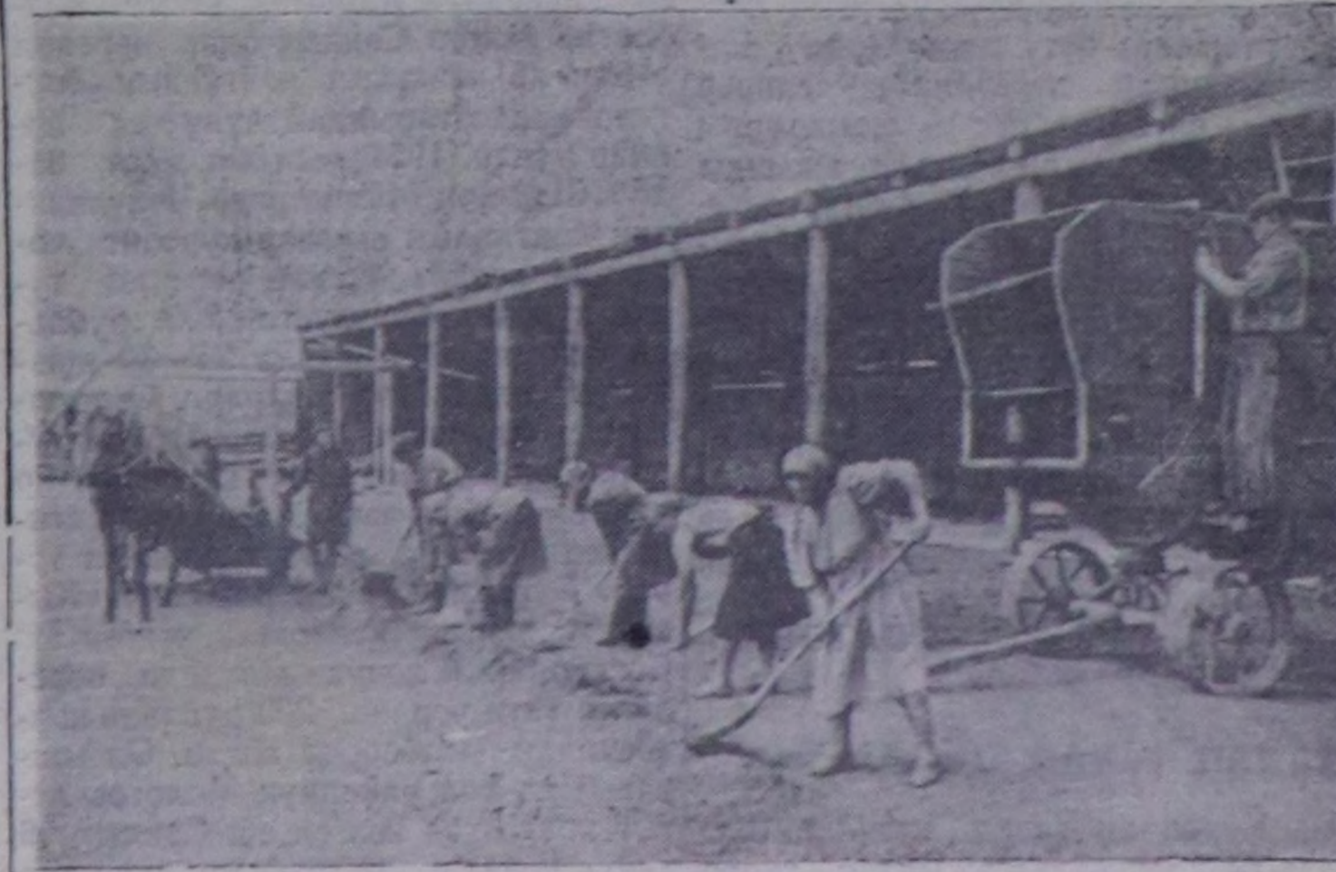
«Элегес» совхозтун тараа арыглар болга ч кургадыр чери.

Шаңнал алганнар бүрүзү партияга, чазакка болгаш ажылчы чоннарныг ынак башкызы болгаш баштыкчызы эш И. В. Сталинга кызыгаар чок ынаан илередип, социалисттиг Төрөөн чуртун чагайдылганыга боттарыныг бүгү күжүн могай-шылап чок бээринге беленин чангыс эп-сеткилди илереткенер.