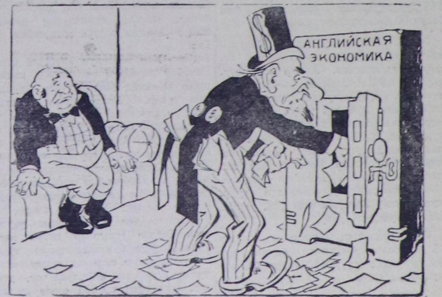
—Че, бистин хөтөөвиске ажыктыг хире чүлүг сен, көрөөлөм чээ! СЭТА-ның прессклешеви.