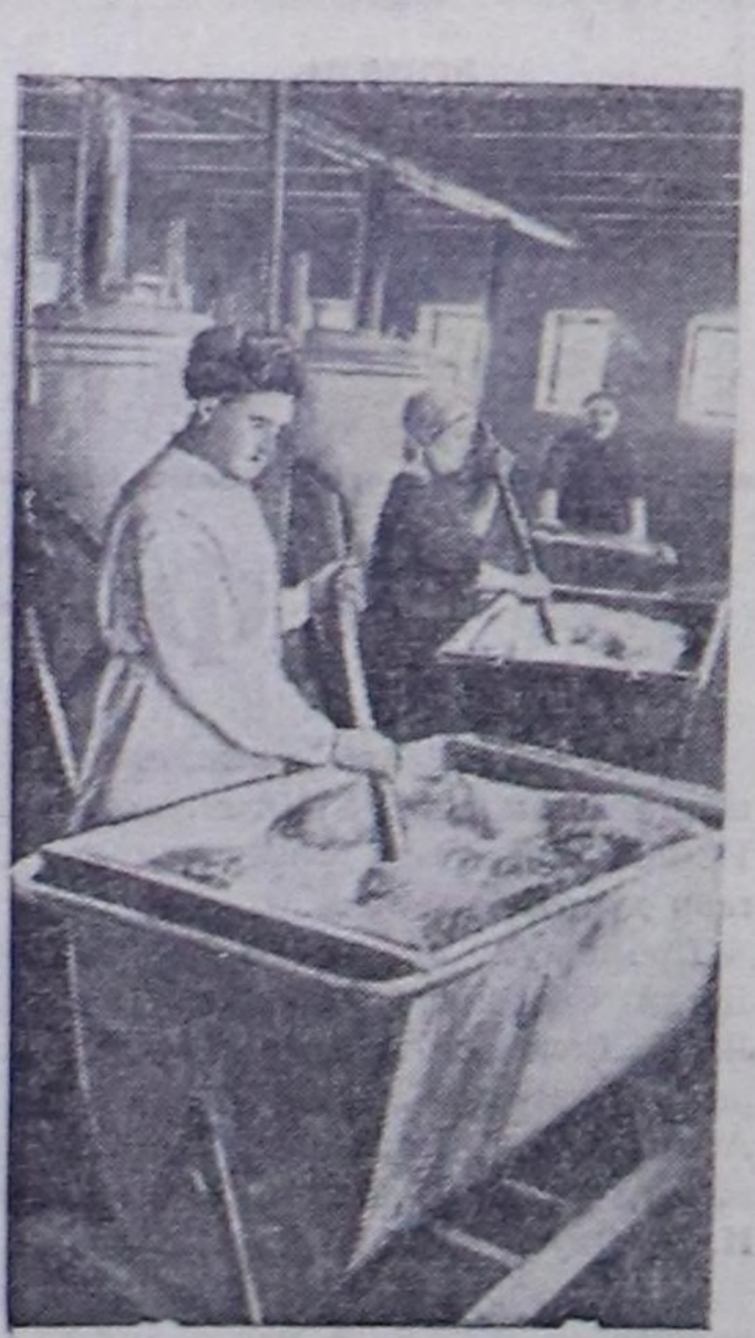
ОДЕССА ОБЛАСТЬ. «Акме-четне ставни» (Думаневский район) хаваан совхозунда мал чемгереринин тускай кухнязын тургускан. Чурукта: мал чемгереринин кухнязында чөм белеткеп турары. Чуруу А. Подберезяныни.

Бистин областың мурнууда туруп турар ажал-агай болгаш политиктиг улуг сорулгалары партиянын пропаган-да ажалынын улам-на айнай күштедир-рин негеп турар. Коммунистер марксизм-ленинизмниг теориязын өөренир талазы-биле оларга негелед хун бүрү-де улугадып турар. Коммунистерниг идеялык деңгелин болгаш политиктиг медерели бектик болган тудум оларнын ажалы түднелдиг болур, практиктиг сорулгалары олар чедилгезин шиттир-лээр.